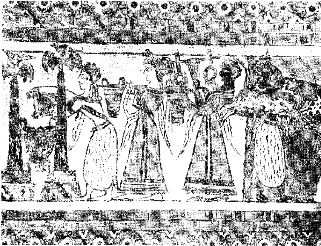
อารยธรรมมীনวน จิตรกรรมของเกาะครีต แสดงขบวนแห่ไปสุสาน