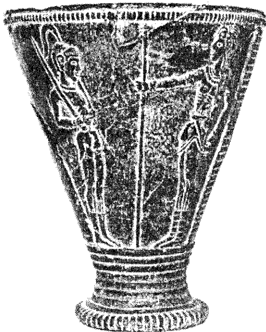
แจกันของหัวหน้าเผ่า