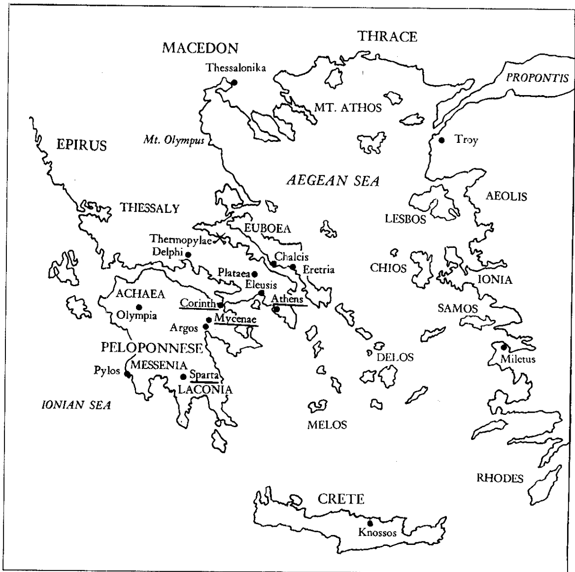
กรีซยุคโบราณ

กลุ่มคอเรียน (Dorians) ผู้มีวิทยาการทหารเหนือกว่าคือ การรบโดยใช้อาวุธทำด้วยเหล็กแข็ง แกร่งคมกล้ากว่าอาวุธทองสำริด