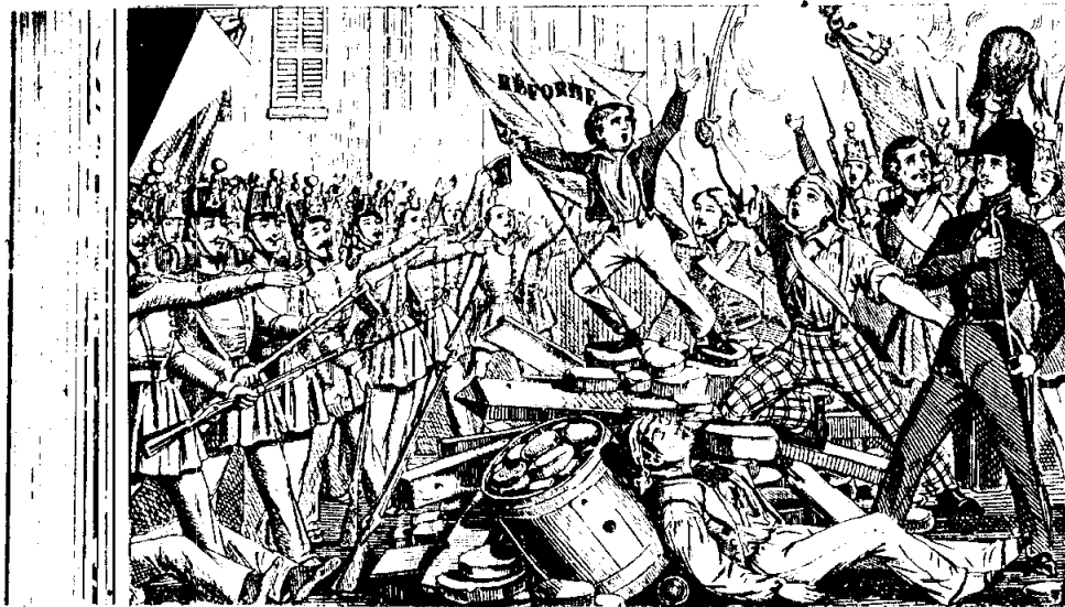
การปฏิวัติปี ค.ศ. 1848 ในฝรั่งเศส

รัฐบาลก็โซต์ดำเนินนโยบายที่ไม่ได้รับความนิยมจากประชาชนเพราะมีการเล่นพรรคเล่นพวก มีการติดสินบนและเกิดการช้อราษฎ์บังหลวงขึ้นอย่างมากมาย จากพฤติกรรมที่เกิดขึ้นดังกล่าว จึงมีการเรียกร้องให้รัฐบาลก็โซต์ลาออก