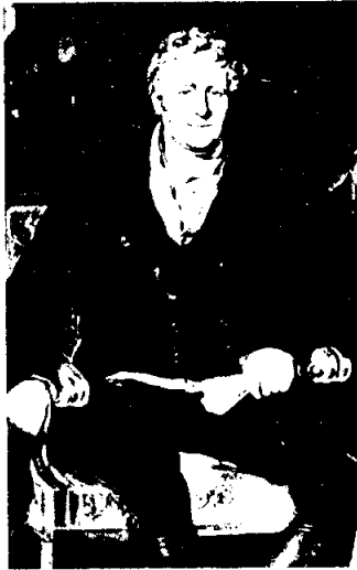
โรเบิร์ต พิล