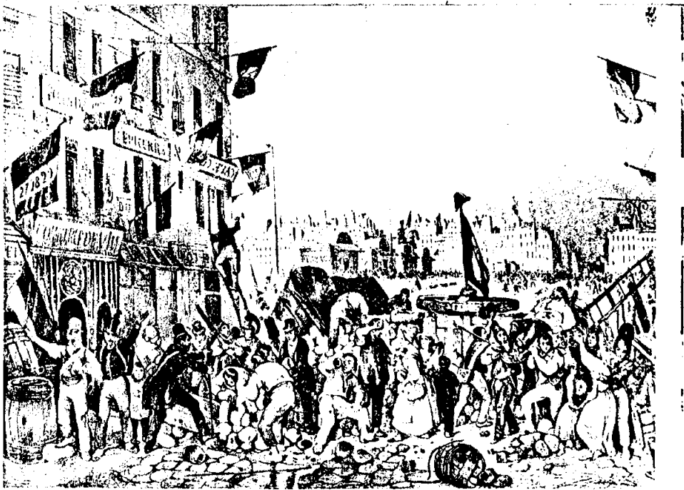
การปฏิวัติในเดือนกรกฎาคม ค.ศ. 1830 ในกรุงปารีส

ในปี ค.ศ. 1829 พระเจ้าชาลส์ที่ 10 ทรงแต่งตั้ง เจ้าชายโปลิแนค (PRINCE JULES OF POLIGNAC) สมาชิกกลุ่มนิยมเจ้า ซึ่งเป็นที่เกลียดชังของประชาชนฝรั่งเศสให้ ขึ้นดำรงตำแหน่งนายกรัฐมนตรี โดยทรงหวังที่จะให้เจ้าชายโปลิแนคช่วยฟื้นฟูการปกครอง ในระบอบสมบูรณาญาสิทธิราชย์ขึ้นมาใหม่ในฝรั่งเศส นอกจากนี้พระองค์ยังทรงขยายอำนาจ ของประเทศฝรั่งเศสโดยการส่งทหารเข้ายึดเมืองอัลเจียส์ (ALGIERS) ซึ่งเป็นรัฐใน อารักขาของอาณาจักรออตโตมานในแอฟริกาเหนือ ให้เข้ามาเป็นส่วนหนึ่งของฝรั่งเศสได้ สำเร็จในเดือนมิถุนายน ค.ศ. 1830