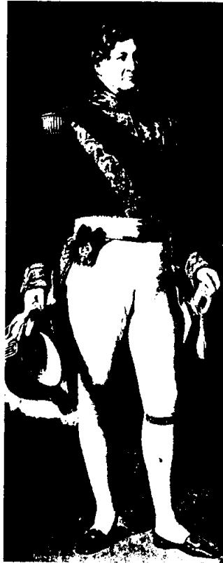
พระเจ้าหลุยส์ ฟิลิป

"พระเจ้าแผ่นดินปกเกล้า แต่มิได้ปกครอง" ๑