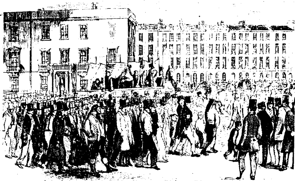
การเดินขบวนของพวกชาร์ทิสต์ ในปี ค.ศ. 1848

ในระหว่างปี ค.ศ. 1840-1842 ได้เกิดความแตกแยกขึ้นในขบวนการชาร์ทิสต์ ในขณะที่เดียวกันร่างกฎบัตรของประชาชนได้ถูกส่งเข้าสู่สภาอีกครั้งในปี ค.ศ. 1842 แต่ก็ไม่ได้ได้รับความเห็นชอบจากรัฐสภา ต่อมาในปี ค.ศ. 1848 ขบวนการชาร์ทิสต์ได้เตรียมการก่อความวุ่นวายขึ้นใหม่ เพราะมีการนำเอาร่างกฎบัตรของประชาชนเข้าสู่สภาอีกครั้ง ส่วนรัฐบาลก็กลัวว่าความวุ่นวายที่จะเกิดขึ้นโดยพวกชาร์ทิสต์ ปรากฏว่ากฎบัตรของประชาชนไม่ผ่านความเห็นชอบจากรัฐสภาแต่ก็ไม่มีเหตุการณ์รุนแรงเกิดขึ้นตามความคาดหมายของรัฐบาล ภายหลังจากนั้นขบวนการชาร์ทิสต์ก็ค่อย ๆ สลายตัวไป ทั้งนี้เพราะขาดผู้นำที่เข้มแข็งและขาดการประสานงานกับสหภาพกรรมกร 17