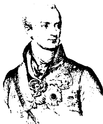
แมคเคอร์นิก

ผลกระทบที่ติดตามมาจากเหตุการณ์ในครั้งนี้คือประชาชนในเมืองปิเดมอนท์ (PIEDMONT) ในอาณาจักรซาร์ดิเนีย (KINGDOM OF SARDINIA) ได้ลุกฮือขึ้นเรียกร้องให้มีการร่างรัฐธรรมนูญเพื่อใช้ในการปกครองประเทศและได้มีการปลุกใจให้มีการรวมอิตาลีเข้าด้วยกัน แต่การลุกฮือของชาวซาร์ดิเนียได้ถูกปราบปรามโดยการเข้าแทรกแซงของออสเตรีย 13