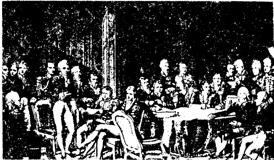
การประชุมที่เวียนนา

ในระยะแรกผู้แทนจาก 4 ประเทศมหาอำนาจซึ่งประกอบไปด้วยผู้แทนของ ออสเตรีย อังกฤษ รัสเซียและปรัสเซีย เป็นกลุ่มที่มีบทบาทเด่นในที่ประชุม ในเวลาต่อมาด้วยความสามารถของผู้แทนฝรั่งเศสจึงทำให้ผู้แทนฝรั่งเศสกลายมาเป็นผู้มีบทบาทเด่นร่วมไปกับผู้แทนจาก 4 ประเทศมหาอำนาจ ผู้แทนที่มีบทบาทเด่นจากทั้ง 5 ประเทศ (BIG FIVE) ประกอบไปด้วย