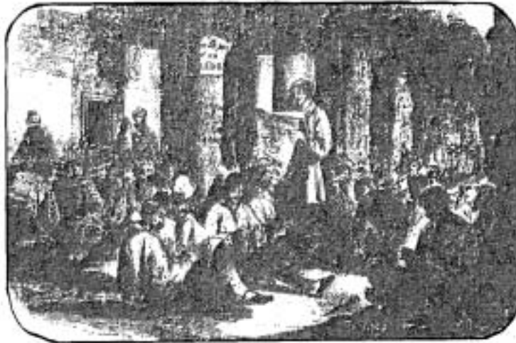
โรงงานแห่งชาติ

การปฏิวัติปี ค.ศ. 1848 ถือเป็นวัฏจักรของการปฏิวัติที่เกิดขึ้นในฝรั่งเศส การปฏิวัติปี ค.ศ. 1789 เป็นการล้มการปกครองในระบอบเก่า การปฏิวัติปี ค.ศ. 1830 เป็นการต่อต้านอภิสิทธิ์ของกลุ่มชนชั้นสูง ส่วนการปฏิวัติในปี ค.ศ. 1848 เป็นการปฏิวัติเพื่อต่อต้านอำนาจรัฐบาลของกลุ่มชนชั้นกลาง เพื่อมอบสิทธิในการเลือกตั้งให้แก่ประชาชนชายที่บรรลุนิติภาวะ เท่ากับเป็นการกระจายอำนาจทางการเมืองมาสู่ประชาชนส่วนใหญ่ของประเทศ