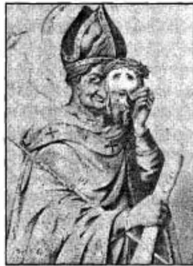
สันตะปาปาไพอัสที่ 9

ภายในรัฐสันตะปาปา สันตะปาปาไพอัสที่ 9 หลังจากที่ได้ทรงพระราชทานรัฐธรรมนูญและได้ทรงแต่งตั้ง รอสซี (ROSSI) ขึ้นเป็นนายกรัฐมนตรี ปรากฏว่าในเวลาต่อมา รอสซีถูกลอบสังหารจนเสียชีวิตไปในเดือนพฤศจิกายน ค.ศ. 1848 สันตะปาปาไพอัส ที่ 9 จึงทรงเลิกสมณโยบายเสรีนิยม และได้เสด็จลี้ภัยไปอยู่ที่เมืองเกตตา (GAETA) ภายใต้การคุ้มครองของพระเจ้าเฟอर्डินานด์ที่ 2 แห่งอาณาจักรเนเป็ลส์และซิซิลี