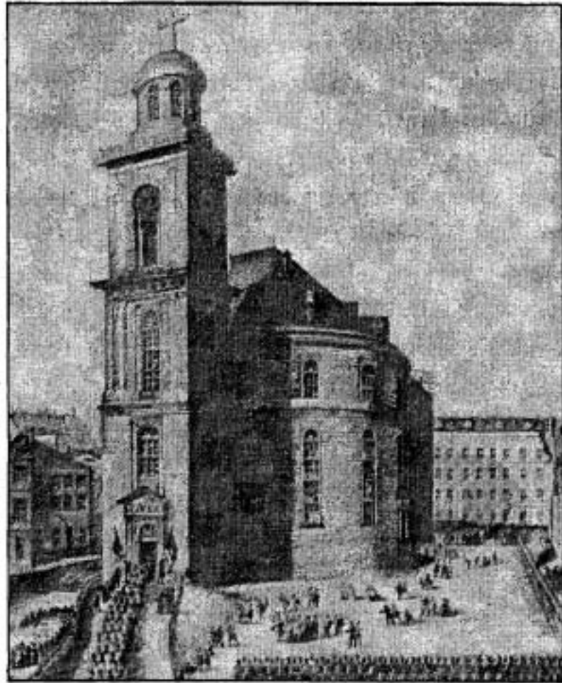
การประชุมสภาแฟรงค์เฟิร์ต ในเดือนพฤษภาคม ค.ศ. 1848