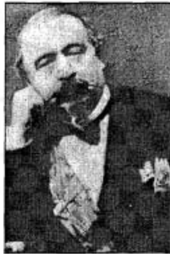
นโปเลียนที่ 3