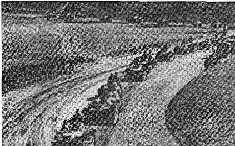
กองกำลังนาซีกำลังเคลื่อนพลเข้าสู่โปแลนด์

สตาลินไม่ค่อยมีความเชื่อมั่นต่อสัญญาที่ทำกับฮิตเลอร์ อย่างไรก็ตาม สตาลินคิดว่าการทำสัญญาดังกล่าวยังมีผลดีในแง่ที่ว่าจะเป็นการเปิดโอกาสให้รัสเซียมีเวลาสร้างความแข็งแกร่งให้กับตนเอง ถึงแม้ฮิตเลอร์จะไม่ปฏิบัติตามสัญญาในภายหลัง