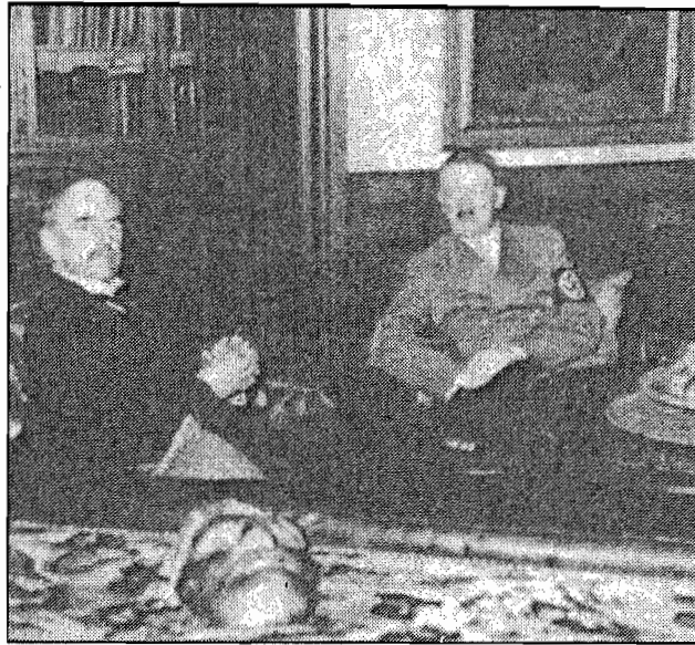
การประชุมที่มิวนิคระหว่างฮิตเลอร์กับแชมเบอร์เลนในเดือนกันยายน ค.ศ. 1938