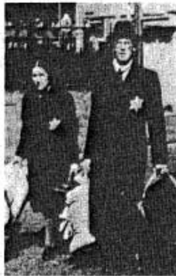
อิวเยอรมันกับเครื่องหมายดาวสีเหลือง

ทางด้านตุลาการก็มีการเปลี่ยนแปลงไปตามคำสั่งของฮิตเลอร์โดยในเดือน พฤษภาคม ค.ศ. 1934 ได้มีการจัดตั้งศาลประชาชนขึ้นเพื่อพิจารณาคดีกบฏ พวกที่ ต่อต้านฮิตเลอร์มักถูกกล่าวหาว่าเป็นกบฏ การดำเนินคดีของศาลประชาชนเป็นการ พิจารณาคดีแบบลับ ส่วนการขอลุทธิคดีจะกระทำได้โดยการยื่นอุทธรณ์ต่อท่านผู้นำ ทางด้านการเมือง พรรคการเมืองอื่นๆ ได้ถูกยุบกลายเป็นพรรคการเมืองนอกกฎหมาย ไปตั้งแต่เดือนกรกฎาคม ค.ศ. 1933 เยอรมนีเหลือพรรคการเมืองเพียงพรรคเดียวคือพรรคนาซี พรรคกลางคาซอติก ซึ่งเคยให้การสนับสนุนในการออกกฎหมายเพิ่มอำนาจทาง การเมืองให้แก่ฮิตเลอร์ ในที่สุดก็ถูกยุบไปเหมือนกับพรรคการเมืองอื่นๆ และคาซอติกก็ยังคงถูกคุกคามจากฮิตเลอร์อยู่เหมือนเดิม จึงนับเป็นเหตุการณ์ครั้งแรกใน ประวัติศาสตร์ที่เยอรมนีได้มีการเปลี่ยนแปลงระบบการกระจายอำนาจมาสู่ระบบการรวม อำนาจเข้าสู่ศูนย์กลางอย่างเด็ดขาดโดยฮิตเลอร์ 25