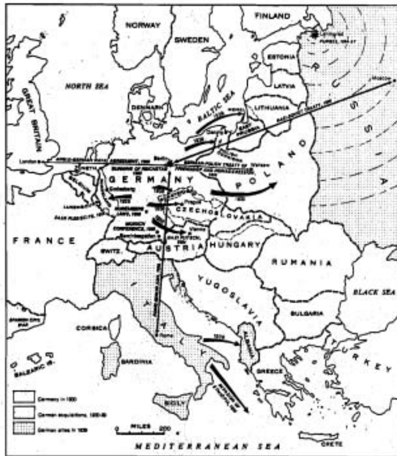
แผนที่ยุโรปก่อนการเกิดสงครามโลกครั้งที่ 2

การสละราชสมบัติของพระเจ้าไกเซอร์วิลเลียมที่ 2 เท่ากับเป็นการล้มการปกครอง ในระบอบกษัตริย์ของเยอรมนี โดยมีรัฐบาลชั่วคราว (PROVISIONAL GOVERNMENT) ภายใต้การนำของพรรคสังคมนิยม (SOCIAL DEMOCRATIC GOVERNMENT) เข้ามาทำหน้าที่แทน พรรคสังคมนิยมเป็นพรรคการเมืองซึ่งได้รับเสียงสนับสนุน เป็นอย่างมากในช่วงก่อนการเกิดของสงครามโลกครั้งที่ 1 ต่อมาในปี ค.ศ. 1918 ก็ได้ เกิดความแตกแยกขึ้นภายในพรรคจนเป็นสาเหตุก่อให้เกิดกลุ่มการเมืองแยกตัวออกมาตั้งนี้ คือ