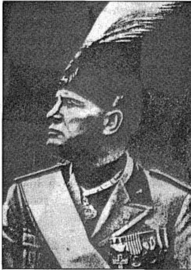
มุสโสลินี

เมื่อเกิดสงครามโลกครั้งที่ 1 ขึ้นในปี ค.ศ. 1914 มุสโสลินีได้เขียนบทความสนับสนุนการกระทำของฝ่ายพันธมิตรและสนับสนุนให้อิตาลีประกาศสงครามกับบอสเตรีย-ฮังการี จึงมีการกล่าวหาว่าเขาได้รับสินบนในการเขียนบทความดังกล่าวจากฝรั่งเศส การกระทำของมุสโสลินีขัดกับนโยบายของพรรคสังคมนิยมซึ่งต่อต้านสงคราม มุสโสลินีจึงถูกบังคับให้ลาออกจากการเป็นสมาชิกพรรคไปในเดือนตุลาคม ค.ศ. 1914 ต่อมาในเดือนพฤศจิกายนปีเดียวกันนี้มุสโสลินีได้ก่อตั้งหนังสือพิมพ์ IL POPOLO D'ITALIA ขึ้นในมิลาน โดยมีนโยบายสนับสนุนให้อิตาลีเข้าร่วมในสงครามโลกครั้งที่ 1 เมื่ออิตาลีเข้าร่วมในสงครามโลกครั้งที่ 1 มุสโสลินีได้ถูกเกณฑ์ไปรบจนกระทั่งเขาได้รับบาดเจ็บจากสมรภูมิจอนโซ (ISONZO FRONT) เขาจึงกลับมาอาศัยอยู่ที่มิลานเพื่อทำหนังสือพิมพ์ และในช่วงนี้เองที่มุสโสลินีได้ตัดขาดจากความคิดทางสังคมนิยม