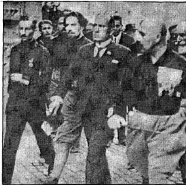
การเดินทางเข้าสู่กรุงโรมของมุสโสลินี