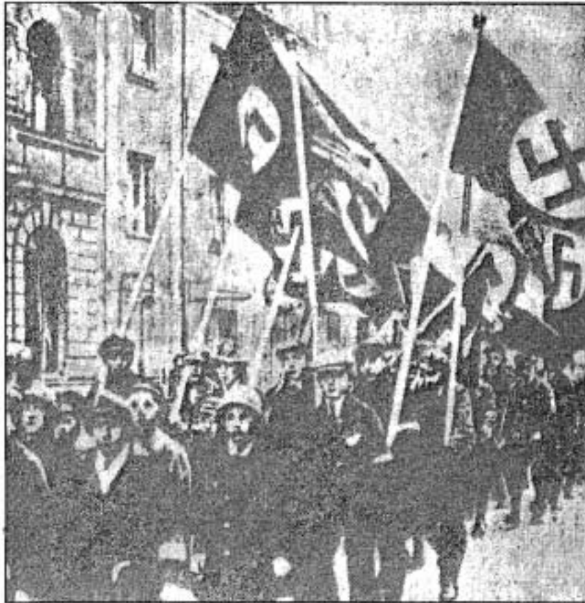
กลุ่มเขาวงกตนาซี

ในปี ค.ศ. 1920 พรรคกรรมกรเยอรมันได้เปลี่ยนชื่อมาเป็นพรรคกรรมกรเยอรมันสังคมนิยม (NATIONAL SOCIALIST GERMAN WORKERS' PARTY) แต่เป็นที่รู้จักกันทั่วไปในนามของพรรคนาซี (NAZI) ในปี ค.ศ. 1921 ฮิตเลอร์ได้ก้าวขึ้นมาดำรงตำแหน่งผู้นำ (FUHRER) ของพรรคโดยมีอำนาจในการตัดสินใจและสั่งการในฐานะตัวแทนของพรรค ฮิตเลอร์สามารถพัฒนาพรรคนาซีให้ได้รับความนิยมอย่างรวดเร็ว โดยเฉพาะฮิตเลอร์เป็นผู้มีพรสวรรค์ในการพูดเร้าความรู้สึกต่อสาธารณชนให้เกิดความคิดเห็นคล้อยตาม 17 (DEMAGOGIC ORATOR)