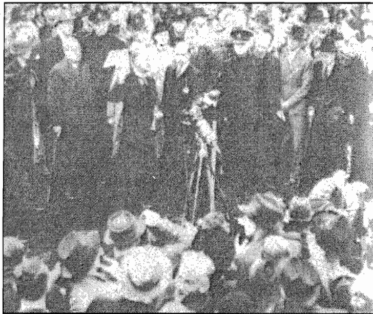
แชมเบอร์เลนกำลังกล่าวกับฝูงชนชาวอังกฤษภายหลังเดินทางกลับจากการประชุมที่มิวนิค