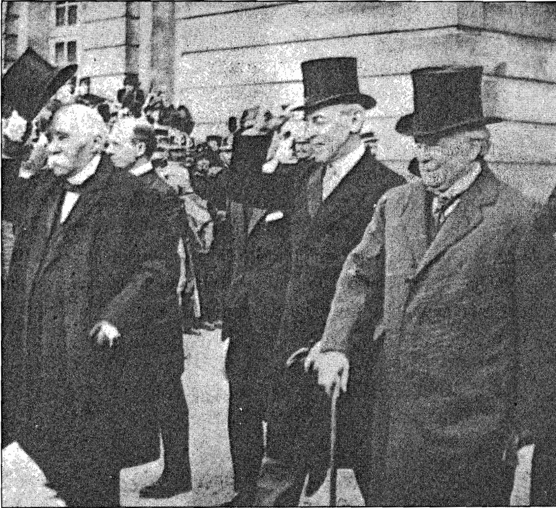
เคลม็องโซ วิลสัน และลอยด์ ยอร์ช

รัฐบาลของชาติต่างๆ ยังคงไม่ยอมรับรองสถานภาพของรัฐบาลไซเวียตส์เซียถึงแม้สงครามกลางเมืองได้ยุติลงแล้วเป็นเวลาหลายปี ต่อมาอังกฤษเริ่มรับรองสถานภาพของรัฐบาลไซเวียตส์เซียในเดือนมกราคม ค.ศ. 1924 สหรัฐอเมริการับรองในปี ค.ศ. 1933 และยูโกสลาเวียรับรองในปี ค.ศ. 1940 16