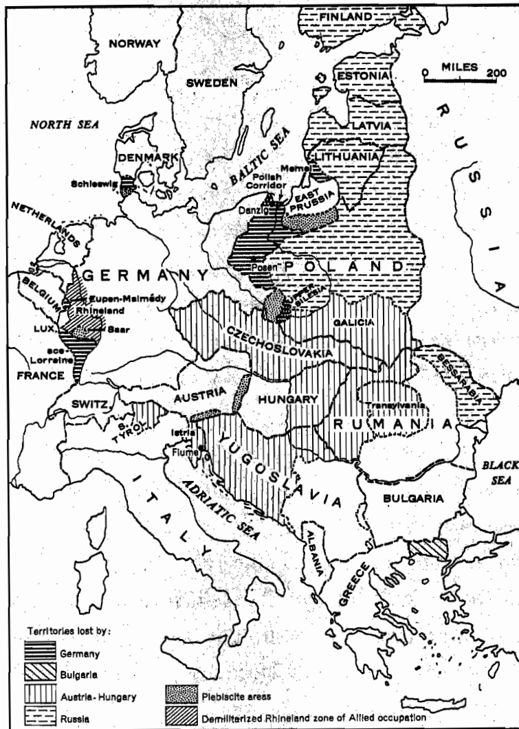
ยุโรปภายหลังจากสงครามโลกครั้งที่ 1 ยุติ