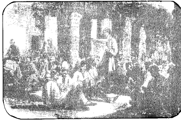
โรงงานแห่งชาติ

การปฏิวัติปี ค.ศ. 1848 ถือเป็นวัฏจักรของการปฏิวัติที่เกิดขึ้นในฝรั่งเศส การปฏิวัติปี ค.ศ. 1789 เป็นการล้มการปกครองในระบอบเก่า การปฏิวัติปี ค.ศ. 1830 เป็นการต่อต้านอภิสิทธิ์ของกลุ่มชนชั้นสูง ส่วนการปฏิวัติในปี ค.ศ. 1848 เป็นการปฏิวัติเพื่อต่อต้านอำนาจรัฐบาลของกลุ่มชนชั้นกลาง เพื่อมอบสิทธิในการเลือกตั้งให้แก่ประชาชนชายที่บรรลุนิติภาวะ เท่ากับเป็นการกระจายอำนาจทางการเมืองมาสู่ประชาชนส่วนใหญ่ของประเทศ