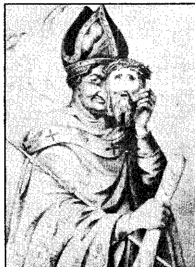
สันตะปาปาไพอัสที่ 9

ภายในรัฐสันตะปาปา สันตะปาปาไพอัสที่ 9 หลังจากที่ได้ทรงพระราชทานรัฐธรรมนูญและได้ทรงแต่งตั้ง รอสซี (ROSSI) ขึ้นเป็นนายกรัฐมนตรี ปรากฏว่าในเวลาต่อมา รอสซีถูกลอบสังหารจนเสียชีวิตไปในเดือนพฤศจิกายน ค.ศ. 1848 สันตะปาปาไพอัส ที่ 9 จึงทรงเลิกสนับสนุนเสรีนิยม และได้เสด็จลี้ภัยไปอยู่ที่เมืองเกตตา (GAETA) ภายใต้การคุ้มครองของพระเจ้าเฟอร์ดินานด์ที่ 2 แห่งอาณาจักรเนเปิลส์และซิซิลี