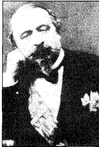
นโปเลียนที่ 3