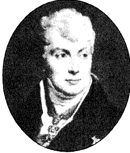
แมตเตอร์นิก

3. การประชุมที่เวโรนา การประชุมที่เมืองเวโรนา (VERONA) ซึ่งอยู่ทางตอนเหนือของอิตาลี ในปี ค.ศ. 1822 นับเป็นการประชุมครั้งสุดท้ายของการประชุมในระบบคองเกรส เนื่องจากได้เกิดการปฏิวัติขึ้นโดยชาวกรีกเพื่อขับไล่อำนาจขององค์สุลต่านแห่งตุรกีออกไปจากดินแดนกรีซ ในขณะที่เดียวกันก็ได้เกิดปัญหาขึ้นในสเปนเนื่องจากความขัดแย้งระหว่างพวกอนุรักษนิยมภายใต้การนำของพระเจ้าเฟอร์ดินานด์ที่ 7 กับพวกเสรีนิยม ปัญหาที่เกิดขึ้นพร้อมกันทำให้ที่ประชุมต้องตัดสินใจพิจารณาปัญหาที่เกิดขึ้นในสเปนเพียงปัญหาเดียวโดยพระเจ้าชาร์ลส์เล็กซานเดอร์ที่ 1 ทรงเสนอที่จะส่งกองทหารรัสเซียจำนวน 150,000 คน เข้าไปปราบปรามพวกเสรีนิยมในสเปน ซึ่งมหาอำนาจอื่นไม่เห็นด้วย ในเวลาต่อมาที่ประชุมจึงได้มอบหมายให้ฝรั่งเศสซึ่งเคยคัดค้านการส่งทหารเข้าไปในสเปน เป็นผู้รับภาระในการฟื้นฟูการปกครองในระบบสมบูรณาญาสิทธิราชย์ขึ้นมาใหม่ในสเปน