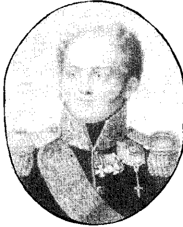
พระเจ้าชาร์อเล็กซานเดอร์ที่ 1

และพระเจ้าเฟรเดอริกวิลเลียมที่ 3 แห่งปรัสเซีย ในเวลาต่อมาก็มีกษัตริย์องค์อื่นๆ ในยุโรปได้ร่วมลงนามในสนธิสัญญาฉบับนี้ ส่วนกษัตริย์หรือผู้ปกครองคนสำคัญที่ไม่ได้ร่วมลงนามในสนธิสัญญาฉบับนี้ได้แก่