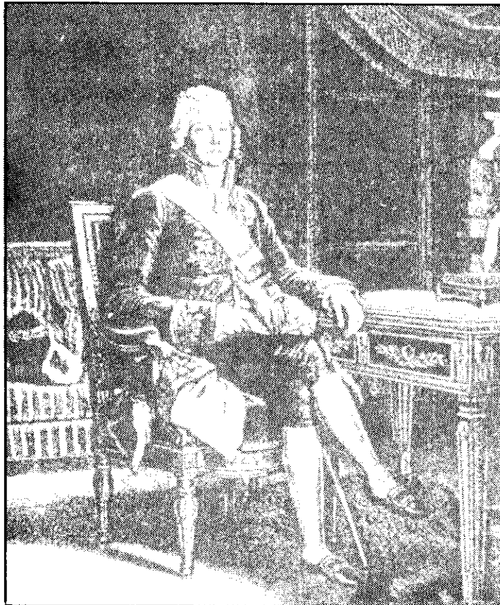
ดอลเลอริงค์

ด้วยความฉลาดและมีประสบการณ์ทางการทูตมาเป็นเวลานาน ดอลเลอริงค์ สามารถทำให้ฝรั่งเศสซึ่งเป็นประเทศที่แพ้สงครามก้าวขึ้นมาเป็นมหาอำนาจ โดยเฉพาการเสนอหลักแห่งความชอบธรรมตามกฎหมาย หรือการคืนสิทธิเดิมให้แก่ราชวงศ์ซึ่งเคยเป็นผู้ปกครองมาก่อนที่นโปเลียนจะก้าวขึ้นมาเป็นกษัตริย์ นอกจากนี้ ดอลเลอริงค์ยังสามารถทำให้ฝรั่งเศสก้าวขึ้นมาเป็นส่วนสำคัญในการประชุมในครั้งนี้อีกด้วย รัสเซียต้องการผนวกดินแดนโปแลนด์ และปรัสเซียต้องการผนวกดินแดนแซกโซนี จึงทำให้อังกฤษและออสเตรียต้องออกมาคัดค้าน ดอลเลอริงค์ได้ฉวยโอกาสเข้าแทรกแซงเหตุการณ์ดังกล่าวโดยให้การสนับสนุนแก่อังกฤษและออสเตรีย ถึงแม้ปัญหาโปแลนด์และแซกโซนีจะสามารถตกลงยุติปัญหาลงได้ในเวลาต่อมา แต่ผลจากเหตุการณ์ที่เกิดขึ้น