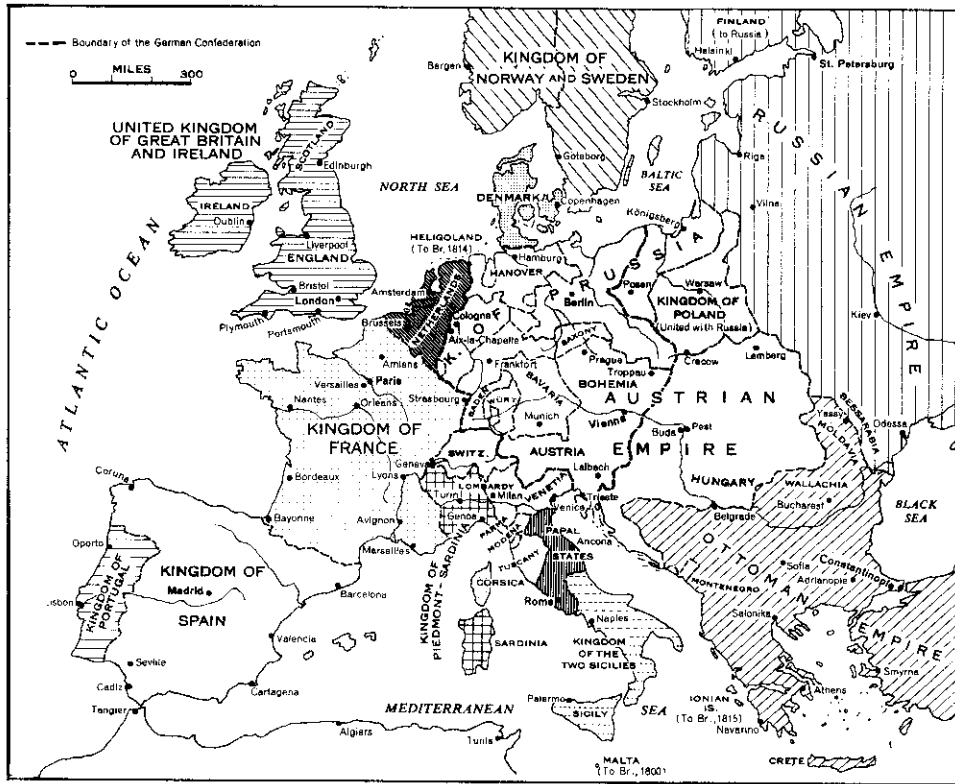
ยุโรปในปี ค.ศ. 1815

ภายหลังการประชุมที่เวียนนาสิ้นสุดลงแล้ว เพื่อเป็นการประกันอนาคตของยุโรป ให้เกิดสันติภาพถาวร กลุ่มประเทศพันธมิตรจึงจัดให้มีการทำสัญญาตกลงกันอีก 2 ฉบับคือ