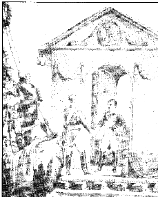
นโปเลียนพบกับชาร์อเล็กซานเดอร์ที่ 1 ในปรัสเซีย

ส่วนปัญหาที่ทำให้รัสเซียต้องได้รับผลกระทบทางเศรษฐกิจเป็นอย่างมากคือการเข้าร่วมในระบบภาคพื้นทวีป ดังนั้นในเดือนธันวาคม ค.ศ. 1811 รัสเซียจึงถอนตัวออกจากการเข้าร่วมในระบบภาคพื้นทวีปหรือระบบการปิดกั้นทางเศรษฐกิจอย่างเป็นทางการ ทำให้ไปเสียนทรงไม่พอพระทัยต่อการกระทำของรัสเซียเป็นอย่างมาก นอกจากนี้ไปเสียน