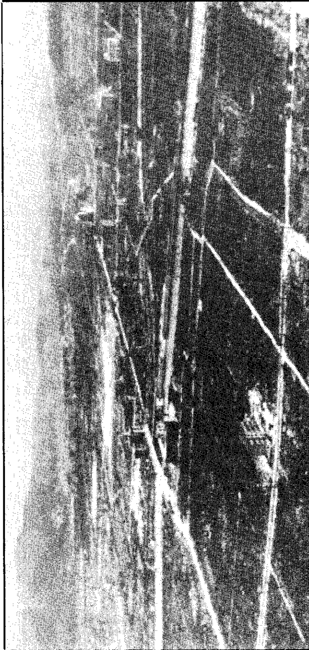
เมืองอิโรชิมาภายหลังถูกล่มด้วยระเบิดปรมาณูครั้งแรก