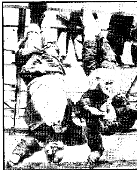
ศพของมุสโสลินีและศพของคลาราถูกแขวนประจานที่เมืองมิลาน

ในวันที่ 9 กันยายน ค.ศ. 1943 กองทหารอเมริกันได้ยกพลขึ้นบกที่เมืองซาลอร์โน (SALERNO) ซึ่งอยู่ทางตอนใต้ของอิตาลี ในเวลาต่อมาก็สามารถยึดครองดินแดนเนเปิลส์ได้ทั้งหมดหลังจากนั้นก็เดินทางขึ้นไปทางตอนเหนือ ฝ่ายเยอรมันได้ป้องกันดินแดนยึดครองในอิตาลีไว้อย่างเหนียวแน่น โดยใช้ความหนาแน่นของอากาศและภูมิประเทศ ซึ่งเป็นภูเขาให้เป็นประโยชน์ในการต่อสู้กับข้าศึก ฝ่ายสัมพันธมิตรจึงใช้แผนการโจมตีโอบล้อม โดยในวันที่ 22 มกราคม ค.ศ. 1944 กองกำลังผสมอังกฤษ-อเมริกันได้ยกพลขึ้นบกที่เมืองแอนซิโอ (ANZIO) ซึ่งอยู่ทางตอนเหนือของเนเปิลส์แต่ฝ่ายเยอรมันได้ถอนกองทัพออกจากบริเวณดังกล่าวไปก่อน ฝ่ายสัมพันธมิตรจึงรุกขึ้นไปทางเหนืออย่างช้าๆ ในวันที่ 4 มิถุนายน ค.ศ. 1944 ก็สามารถยึดกรุงโรมเอาไว้ได้ ต่อมาในเดือนสิงหาคมก็สามารถยึดเมืองฟลอเรนซ์ซึ่งฝ่ายสัมพันธมิตรได้ตั้งกองบัญชาการขึ้นเพื่อเตรียมเดินทางเข้าสู่ฝรั่งเศสและยุโรปตะวันออก