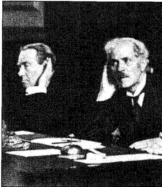
แอสตันเลย์ บอลด์วิน และ แรมเซย์ แมกโดแนลด์ ได้ร่วมกันจัดตั้งรัฐบาลแห่งชาติขึ้น ในระหว่าง ปี ค.ศ. 1931-1935