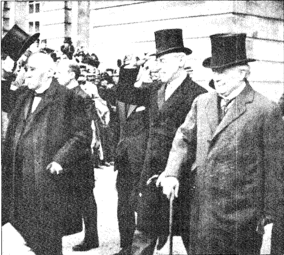
เคลมอนโซ วิลสัน และลอร์ด ยอร์ช

รัฐบาลของชาติต่างๆ ยังคงไม่ยอมรับรองสถานภาพของรัฐบาลโซเวียตรัสเซีย ถึงแม้สงครามกลางเมืองได้ยุติลงแล้วเป็นเวลาหลายปี ต่อมาอังกฤษเริ่มรับรองสถานภาพ ของรัฐบาลโซเวียตรัสเซียในเดือนมกราคม ค.ศ. 1924 สหรัฐอเมริการับรองในปี ค.ศ. 1933 และยูโกสลาเวียรับรองในปี ค.ศ. 1940 16