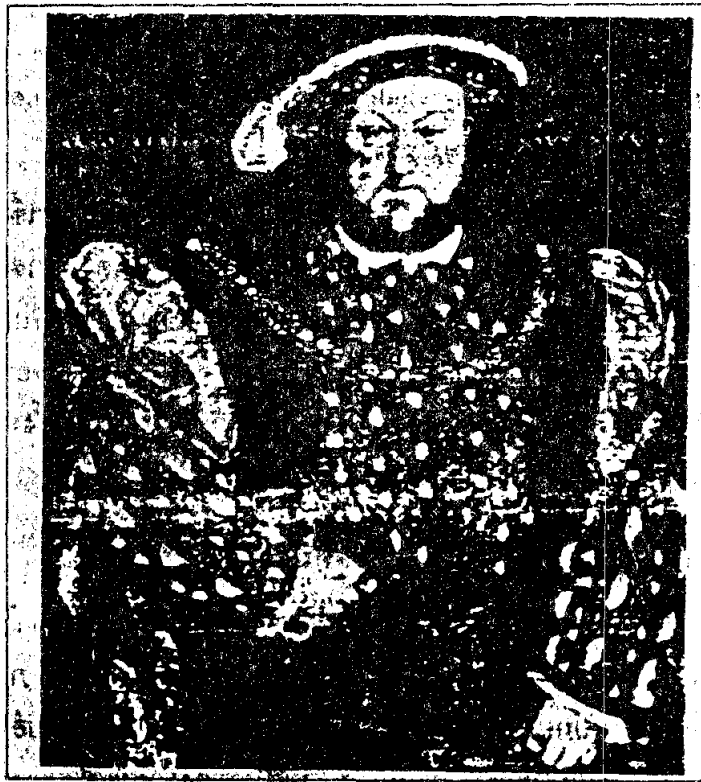
ภาพพระเจ้าเฮนรีที่ 8

พระเจ้าเฮนรีที่ 8 (Henry VIII, ค.ศ. 1509-1547) 1 มีเหตุการณ์สำคัญที่เกิดขึ้นในสมัยนี้ คือ การปฏิรูปศาสนาอังกฤษ ตั้งลัทธินิกายอังกฤษ (Church of England) ด้วยการแก้ไขพิธีกรรมให้กะทัดรัดและง่ายขึ้น ให้กษัตริย์อังกฤษเป็นประมุขทางศาสนา และไม่มีการนับถือสันตะปาปาที่โรม นอกนั้นเหมือนศาสนาคริสต์โรมันคาทอลิกทุกประการ จนศาสนานิกายอังกฤษได้ชื่อว่า Catholic without Pope เหตุการณ์ครั้งนี้ทำให้กษัตริย์อังกฤษมีอำนาจเพิ่มมากขึ้น เป็นอิสระจากอำนาจของสันตะปาปาที่กรุงโรม และไม่ต้องเสียภาษีทางศาสนาให้แก่สันตะปาปา