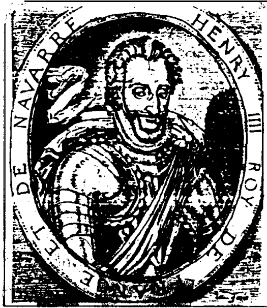
ภาพเฮนรีแห่งนาวาร์