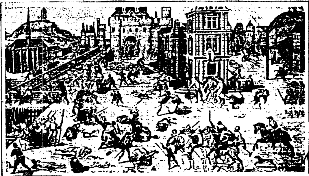
ภาพการสังหารหมู่พวกฮิวเกอโนต์ในวันเฉลิมฉลองนักบุญบาร์โธโลมิว