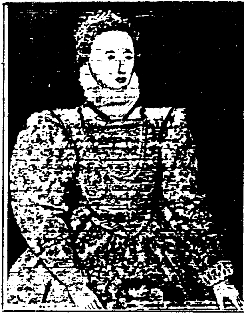
ภาพพระนางเอลิซาเบธที่ 1

เล่มเดียวกันทั่วประเทศ มีผลทำให้สันตะปาปาไพอุสที่ 5 (Pope Papius V) ไม่พอใจประกาศ ขับพาศนียกรรม (Excommunicate) พระนางเอลิซาเบธที่ 1 ออกจากศาสนาใน ค.ศ. 1570 แต่รัฐสภาได้ช่วยเหลือพระนางด้วยการออกพระราชบัญญัติการเป็นกบฏ (Treason Act) ใน ค.ศ. 1571 กำหนดว่าผู้ใดแสดงว่าพระนางเอลิซาเบธที่ 1 เป็นคนนอกศาสนาไม่สมควรจะเป็น ประมุขของประเทศอังกฤษจะถูกกล่าวหาเป็นกบฏ กฎหมายฉบับนี้ออกมาเพื่อปราบปราม ความวุ่นวายในอังกฤษ อันอาจเกิดจากพวกคาทอลิกหรือโปรเตสแตนท์