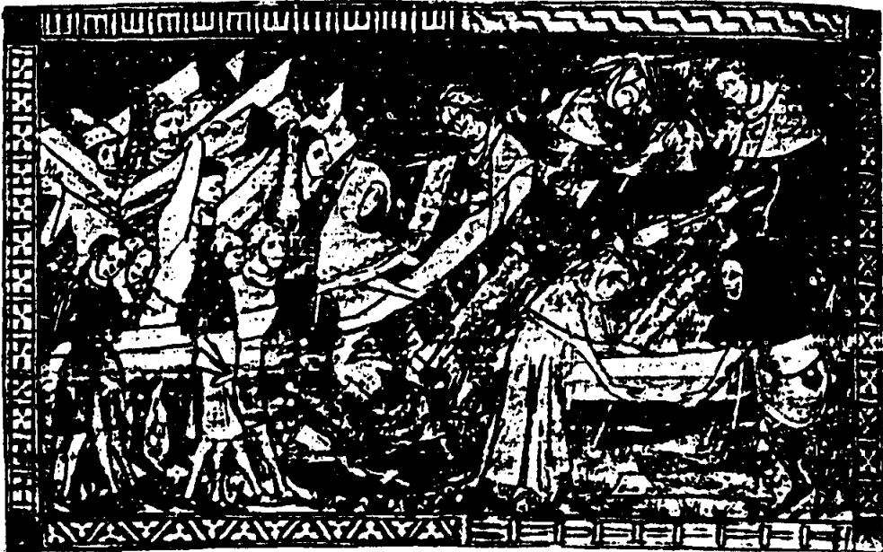
ภาพกาฬโรคระบาด

ในระหว่างสงครามร้อยปี มีเหตุการณ์สำคัญเกิดขึ้นในยุโรป คือการเกิดโรคระบาดกาฬโรค (Black Death) 3 ระหว่าง ค.ศ. 1347-1349 กาฬโรคระบาดได้เริ่มขึ้นเป็นครั้งแรกที่อิตาลีใน ค.ศ. 1347 เชื้อโรคนี้ได้แพร่มาจากตะวันออกและบริเวณคาบสมุทรไครเมีย แล้วกระจาย