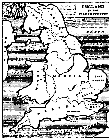
ภาพแผนที่อังกฤษในศตวรรษที่ 18

ในศตวรรษที่ 9 พวกเดนส์ (Danes) เข้ามารุกรานเกาะอังกฤษอย่างหนัก พระเจ้าอัลเฟรดผู้ยิ่งใหญ่ (Alfred, The Great, ค.ศ. 871-877) 1 แห่งอาณาจักรแองโกล-แซกซอน เป็นผู้นำสำคัญ