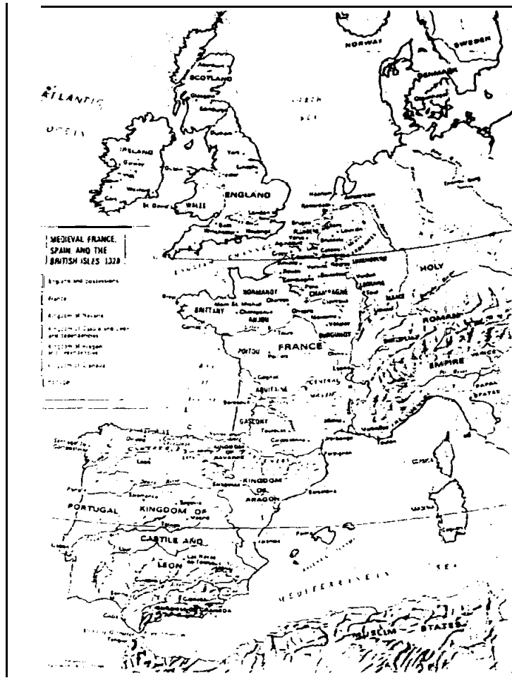
ภาพแผนที่ฝรั่งเศส สเปน และอังกฤษ ค.ศ. 1328