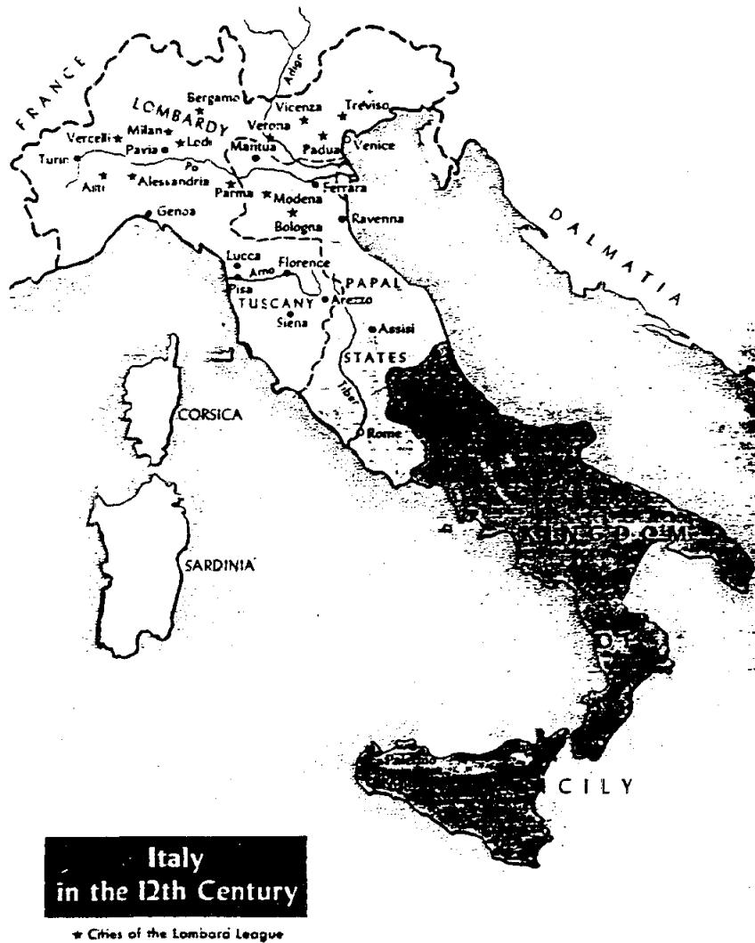
ภาพแผนที่อิตาลีในศตวรรษที่ 2