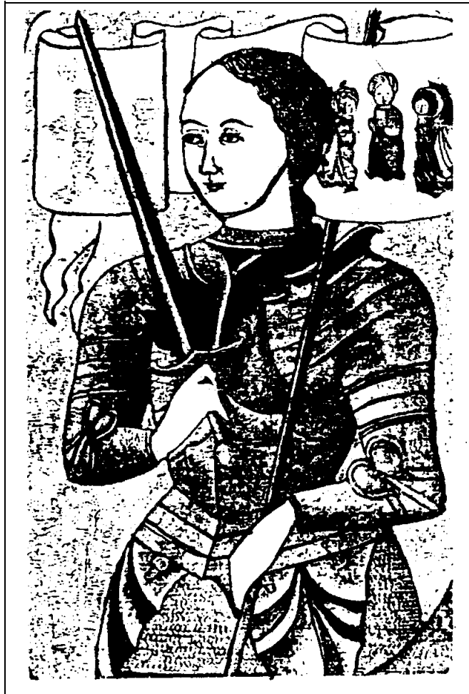
ภาพ โจน ออฟ อาร์ค

แห่งชาติ (Estate General) ยอมรับว่าอำนาจของกษัตริย์ฝรั่งเศสที่จะเรียกเก็บภาษี และจัดกองทัพ ในยามฉุกเฉิน ฉะนั้นกษัตริย์จึงมีอำนาจสูงสุดเพราะกุมอำนาจการเงินและการทหารไว้