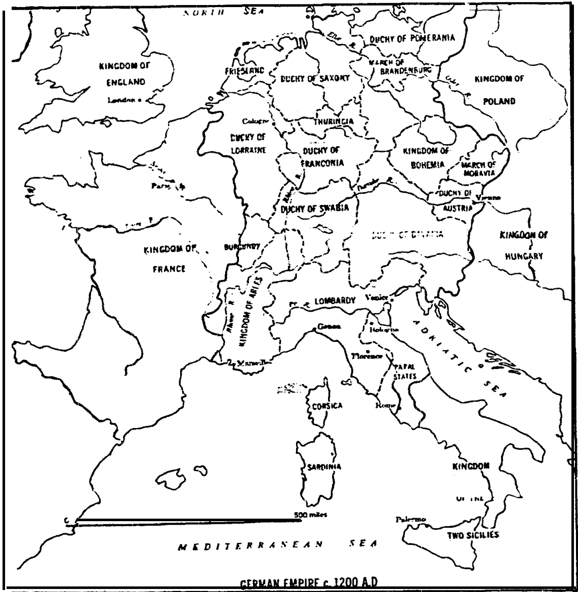
ภาพแผนที่จักรวรรดิเยอรมัน ค.ศ. 1200

ในค.ศ. 1190 พระเจ้าเฟรเดอริกที่ 1 ได้เสด็จไปสงครามครูเสดเพื่อความยิ่งใหญ่ของจักรพรรดิ และเรือพินประเพณีที่ว่า จักรพรรดิเป็นผู้ปกป้องศาสนา แต่พระองค์สิ้นพระชนม์จมน้ำตายในระหว่างทางที่เอเชียไมเนอร์