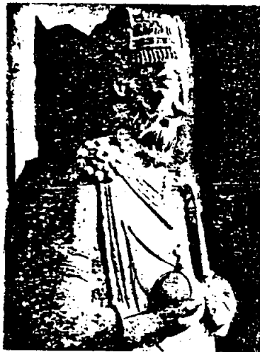
ภาพพระเจ้าชาร์ลเลอมาญอยู่ในชุดเสื้อคลุมขนนาง ชั้นสูงของพวกแฟรงก์ มือถือลูกแก้ว และคทาเป็น เครื่องราชกกุธภัณฑ์

กษัตริย์เปแปงที่ 3 สิ้นพระชนม์ใน ค.ศ. 768 อาณาจักรแฟรงก์ถูกแบ่งออกเป็น 2 ส่วน ครอบครองโดยชาร์ลส์ โอรสองค์ใหญ่ ต่อมาได้รับการยกย่องเป็นชาร์ลเลอมาญหรือชาร์ลส์ ผู้ยิ่งใหญ่ (Charlemagne หรือ Charles, The Great, ค.ศ. 768-814) ได้ดินแดนทางเหนือและทางตะวันตก ส่วนโอรสองค์เล็ก คือคาร์โลมาญ ได้ดินแดนทางใต้และทางตะวันออก ต่อมาอีก 3 ปีใน ค.ศ. 771 คาร์โลมาญสิ้นพระชนม์ ชาร์ลส์จึงได้ปกครองอาณาจักรแฟรงก์แต่ผู้เดียว และได้สร้างความเป็นปึกแผ่นให้แก่อาณาจักรแฟรงก์ ของราชวงศ์คาโรลิงเจียน จนกลายเป็นกษัตริย์ผู้ยิ่งใหญ่ของยุโรปตะวันตก