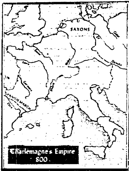
ภาพอาณาจักรชาร์เลอมาญ ค.ศ. 800