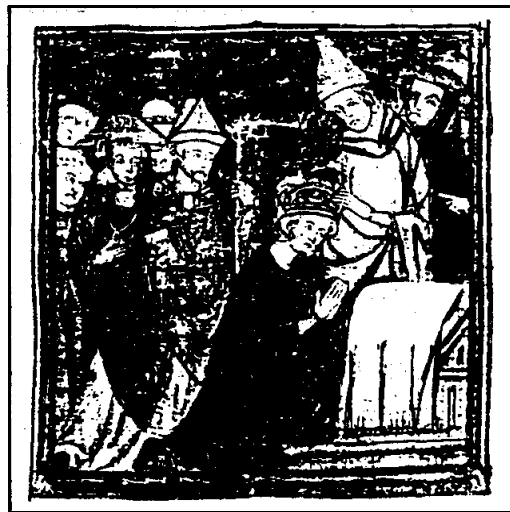
ภาพสันตะปาปาสิโอที่ 3 สวมมงกุฎให้พระเจ้าชาร์ลเลอมาญ ผู้กำลังคุกเข่าอยู่ที่โบสถ์เซนต์ปีเตอร์

ขอความช่วยเหลือจากจักรพรรดิซีโน (Emperor Zeno) แห่งจักรวรรดิโรมันตะวันออกได้ เพราะมีเรื่องพิพาทกันอยู่ ดังนั้นสันตะปาปาสิโอที่ 3 ได้ขอความช่วยเหลือมายังจักรพรรดิชาร์ลเลอมาญ ซึ่งได้เสด็จมาอิตาลีอีกครั้งหนึ่งใน ค.ศ. 800 ซึ่งเป็นปีที่สำคัญมากทั้งทางด้านอาณาจักรและศาสนจักร กล่าวคือ เมื่อวันที่ 25 ธันวาคม ค.ศ. 800 ซึ่งตรงกับวันคริสต์มาส สันตะปาปาสิโอที่ 3 ถือเป็นโอกาสดี ด้วยการสวมมงกุฎให้กับจักรพรรดิชาร์ลเลอมาญ ขณะที่พระองค์คุกเข่ากับพื้นและสวดมนต์อยู่ในโบสถ์เซนต์ปีเตอร์ ในขณะที่เดียวกันพวกเจ้าขุนนางที่เข้ามาร่วมประชุมได้เปล่งเสียงถวายพระพร “To Charles Augustus Crowned by God, Great and Pacific Emperor of the Romans, Life and Victory...!” 1 สันตะปาปายังได้ทำพิธีราชาภิเษกทางศาสนา แบบที่เคยปฏิบัติต่อจักรพรรดิแห่งจักรวรรดิโรมันตะวันตกในอดีต เท่ากับว่าเป็นการรื้อฟื้นจักรวรรดิโรมันขึ้นมาใหม่ทางตะวันตก ซึ่งเว้นว่างไปเป็นเวลา 324 ปี ตั้งแต่ ค.ศ. 476 เป็นต้นมา เหตุการณ์ครั้งนี้มีความสำคัญมากต่อประวัติศาสตร์ทั้งทางด้านอาณาจักรและศาสนจักร เพราะต่อไปสถาบันสันตะปาปาจะอ้างอำนาจสิทธิขาดในการแต่งตั้ง และถอดถอนผู้นำของดินแดนต่าง ๆ จนทำให้เกิดความขัดแย้งกันระหว่างสถาบันสันตะปาปากับสถาบันกษัตริย์ และแตกแยกกันที่สุดในที่สุด