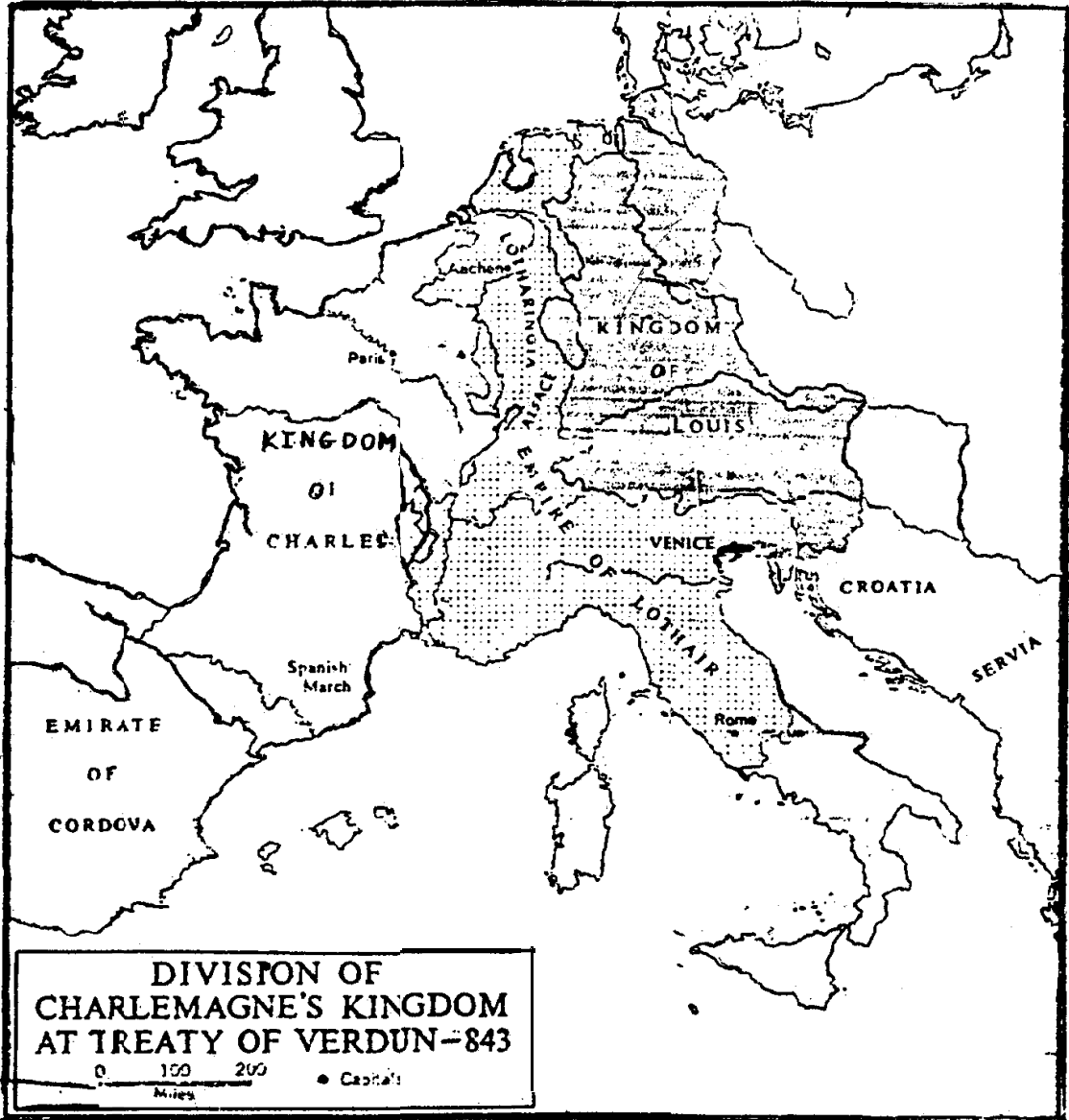
ภาพแผนที่อาณาจักรแฟรงค์ ตามสนธิสัญญาแวร์ดัง ค.ศ. 843

อำนาจในจักรวรรดิ ทำให้ตำแหน่งจักรวรรดิโดยความหมายลง ษัตริย์ก็มีความสำคัญเท่าเทียมกับจักรพรรดิ ทั้งในด้านศักดิ์ศรีและอำนาจ โดยที่จักรพรรดิโลธาร์เอง ต้องยอมรับสภาพดังกล่าว เพราะไม่มีกำลังอำนาจที่จะบังคับษัตริย์แห่งอาณาจักรแฟรงค์ตะวันตก และตะวันออกได้ เพราะจักรพรรดิโลธาร์ยังต้องเผชิญศึกหลายด้านจากพวกซาราเซ็นทางใต้ และพวกไวคิงทางเหนือ