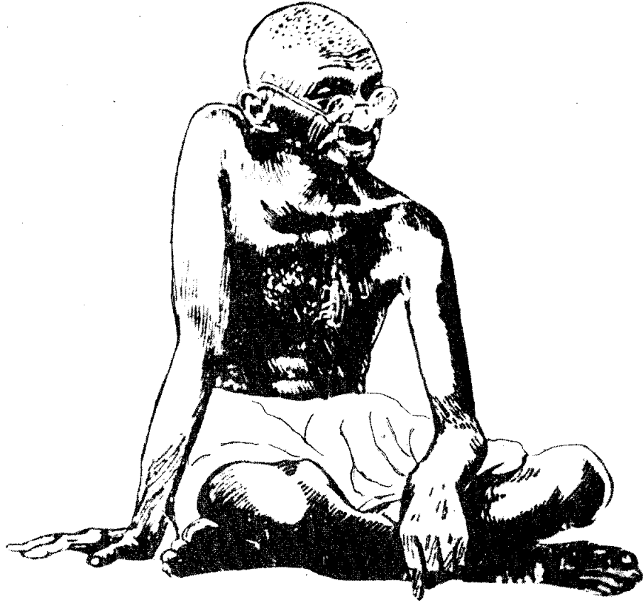
ความจริง อหิงสา มีกำลังใจเข้มแข็ง คือพลังแบบมีเหตุผล