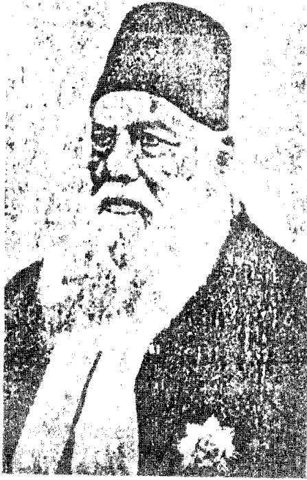
เซอร์ ซเยค อาห์เหมด ช่าน

ผู้นำในกลุ่มมุสลิมในช่วงนั้นคือ เซอร์ ซเยค อาห์เหมด ช่าน ท่านได้เขียนหนังสือมากมายหลายเล่ม และได้เข้ารับราชการ เป็นข้าราชการผู้น้อยในหน่วยงานของรัฐ ท่านได้