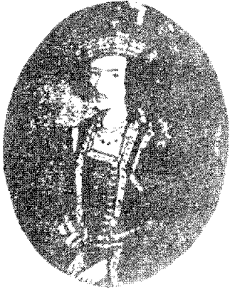
ราชา राम โมहन รอย

สนใจในคำสอนของศาสนาฮินดูมากนัก การปฏิเสธรายธรรมตะวันตกอย่างสิ้นเชิงนั้น เริ่มต้นด้วยพราหมณ์ที่เป็นพวกอนุรักษนิยม ซึ่งทำให้อังกฤษผู้ปกครอง และมีชนนารีรู้สึกตกใจ พราหมณ์หัวอนุรักษนิยมเหล่านี้ นำโดย ราชา राम โมहन รอย ซึ่งเป็นชาวเบงกาลี เกิดในปี