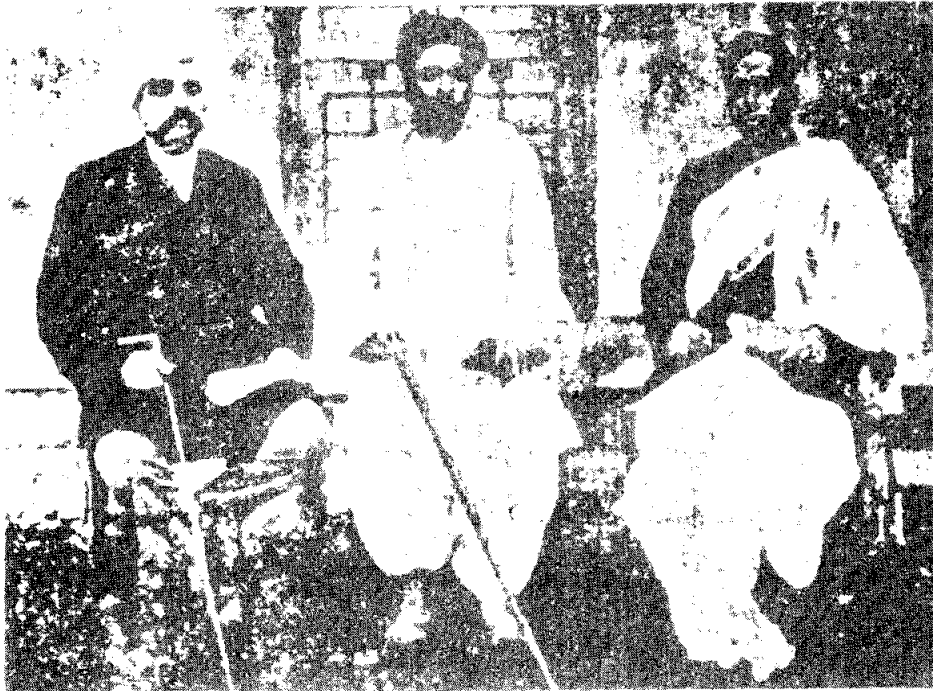
ภาพผู้นำในการสร้างลัทธิชาตินิยม