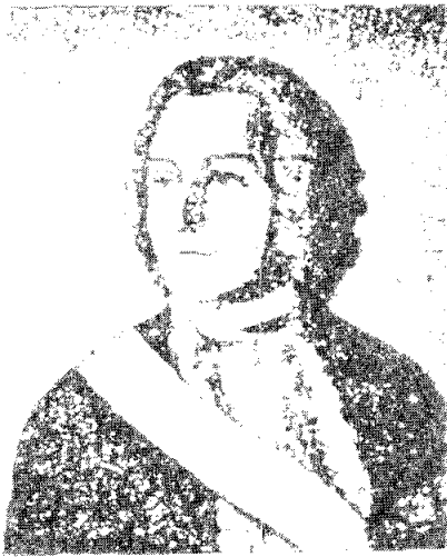
ฟรังซัว ดูเปลซ์

สงครามการค้า นาคิก เป็นสงครามระหว่างอังกฤษ ฝรั่งเศส ในช่วงนั้น ฟรังซัว ดูเปลซ์ ได้เข้ามาเป็นข้าหลวงใหญ่ฝรั่งเศสประจำพอนดิเชอร์รี่ ซึ่งเขามีความตั้งใจแน่วแน่ที่จะขับไล่ให้อังกฤษพ้นไปจากอินเดีย แต่ดูเปลซ์ทำได้ไม่ถนัด ต้องประสบกับภาวะยุ่งยากหลายอย่าง กorb กับอังกฤษมีรากฐานทางการค้าในอินเดียมั่นคงพอสมควร เห็นได้จากอังกฤษมีศูนย์กลางการค้าในเมืองใหญ่ ๆ ถึง 3 เมืองคือ บอมเบย์ มัทราส กัลกัตตา สงครามการค้า นาคิก ครั้งแรกนี้ เป็นผลมาจากการแย่งชิงราชสมบัติกันในประเทศออสเตรียในยุโรป อังกฤษช่วยฝ่ายหนึ่งรบ ขณะเดียวกันฝรั่งเศสเข้าข้างอีกฝ่ายหนึ่ง ดูเปลซ์ข้าหลวงใหญ่พอนดิเชอร์รี่