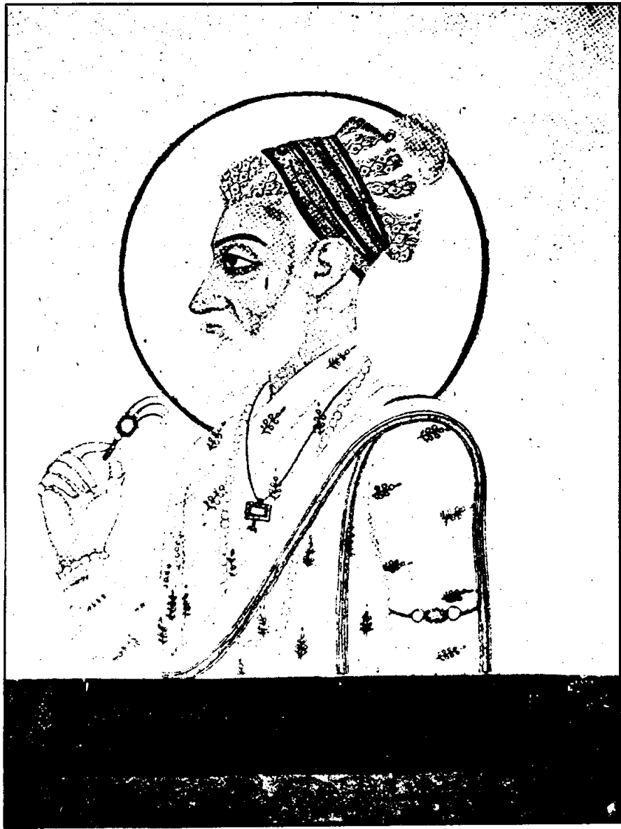
ภาพพระเจ้าโอรังเซิน