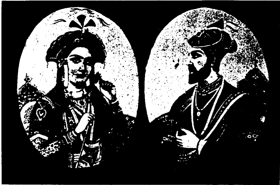
ภาพพระนางมณฑิชาและพระเจ้าชาห์เจฮาน