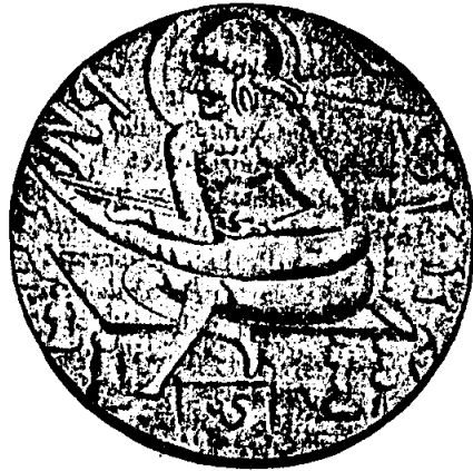
ภาพเทียฉัตรแสดงภาพพระเจ้าสุทโธทัญ