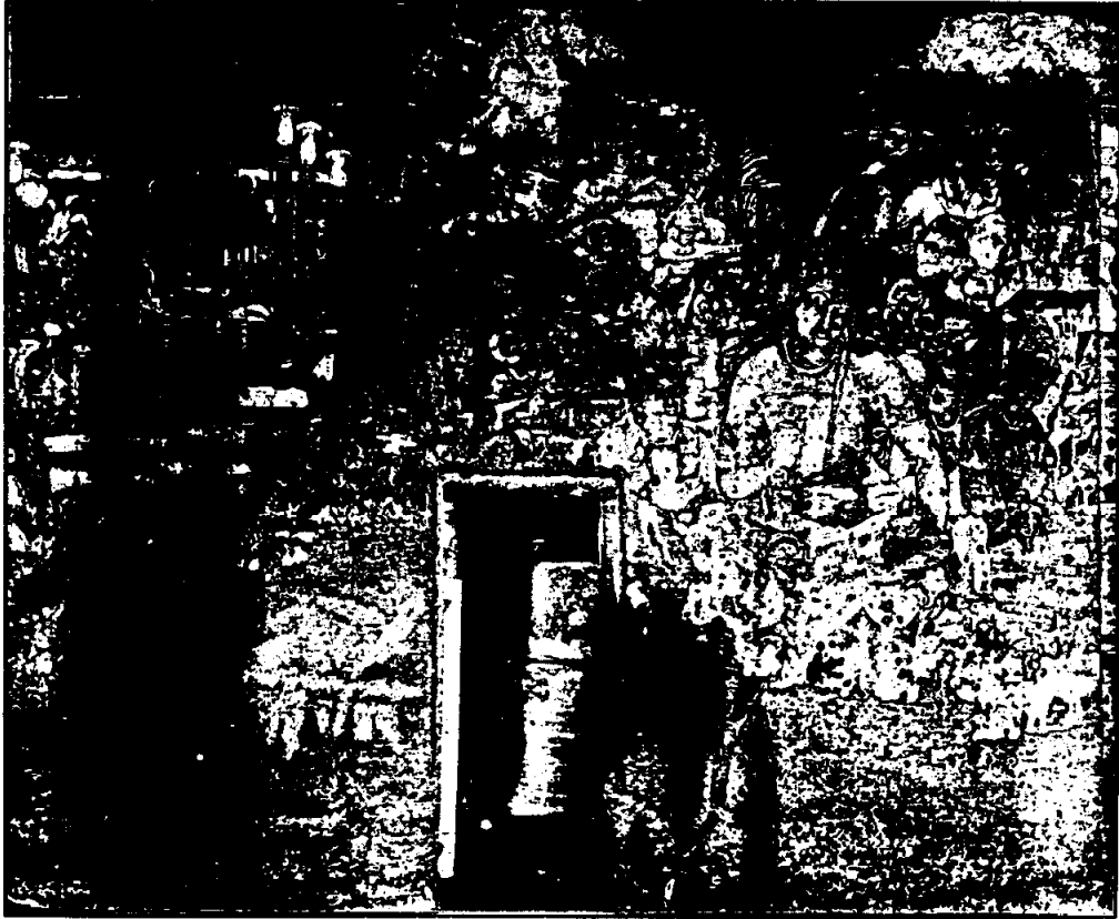
ภาพธิดาพระยามารบนผนังถ้ำอะซันดา