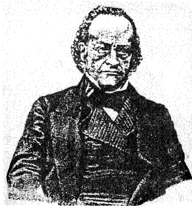
ภาพเซอร์จอห์น บาวริง

พิกัดภาษีนอกในที่เรียกเก็บใหม่ตามสัญญาที่ทำขึ้น ปรากฏว่าพิกัดสินค้าภาษีชั้นใน ไม่ต้องเสีย เสียแต่เมื่อบรรทุกลงเรือ ได้แก่สินค้าต่อไปนี้ 77