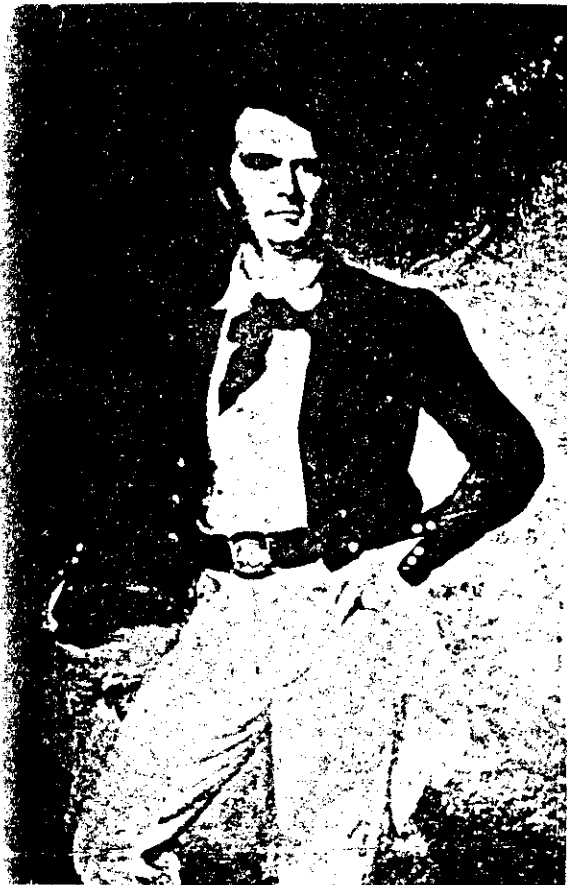
ภาพเซอร์เจมส์ บรูค

6. เรือสินค้าอังกฤษจะนำสินค้าเข้ามาหรือเอาสินค้าออกไป หรือทั้งนำสินค้าและ เอาสินค้าออกไป จะต้องเสียค่าปากเรือ 500 บาท รวมค่าภาษีและธรรมเนียมต่าง ๆ ทั้งหมด เมื่อเรือลำใดเสียค่าปากเรือแล้ว จะแวะจอดขนของขึ้น หรือบรรทุกของลงเรืออีกที่เมืองท่า ก็ไม่ต้องเสียอะไรอีกในเที่ยวนั้น ถ้าเรืออังกฤษลำใดเข้ามาในเมืองท่าของไทยเพียงเพื่อ ช่อมแซมหรือ ชื้อเสบียงอาหาร หรือตามไต่ราคาสินค้าไม่ต้องเสียค่าปากเรือ