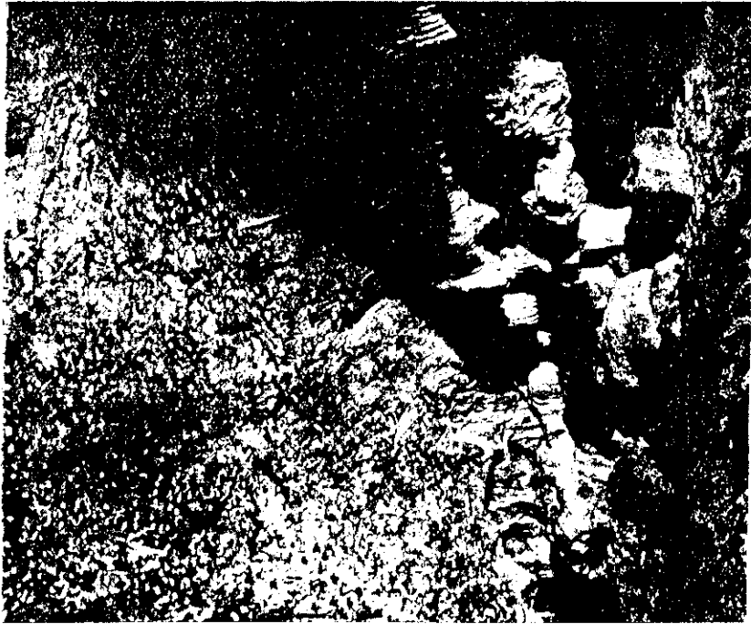
ตำนานเกาะลังกาจิว ทสมเด็จพระจุลจอมเกล้าเจ้าอยู่หัว สมเด็จพระจุลจอมเกล้าเจ้าอยู่หัว เรื่องเสด็จประพาส 9, 117, 120 รวม 4 คราว (พระนคร : โรงพิมพ์ไท,

ยึดอาชีพเป็นพรานล่าสัตว์อยู่ทั่วไปในราชอาณาจักร และมีประจำตัวทุกหมู่บ้านทุกตำบล ทีเดียว 47 คุณสมบัติของพรานไทยก็ได้ชื่อว่ามี ความกล้าหาญประเปรียวและชำนาญมาก 48