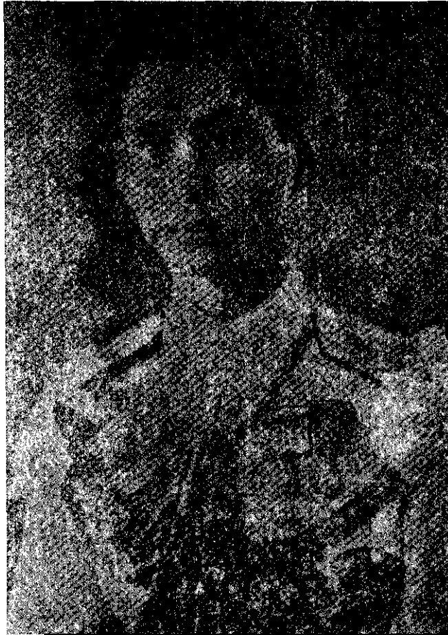
ภาพที่ 35 รัชกาลที่ 8 ในหลวงอานันทมหิดล