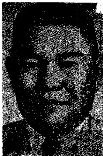
ภาพที่ 34 นายทวี บุณยเกตุ

การพิจารณาจัดตั้งคณะรัฐบาลชุดใหม่สืบต่อจากรัฐบาลชุดนายควง อภัยวงศ์ นั้น นายปรีดี พนมยงค์ ในฐานะผู้สำเร็จราชการแทนพระองค์ และสภาได้พิจารณาร่วมกัน และมีความเห็นว่าควรเชิญ ม.ร.ว.เสนีย์ ปราโมช หัวหน้าเสรีไทยในอเมริกา มาจัดตั้งรัฐบาลเพราะ ม.ร.ว.เสนีย์ ปราโมช แสดงการคัดค้านนโยบายของรัฐบาลจอมพล ป. พิบูลสงคราม ในเรื่องการประกาศสงครามกับอังกฤษและอเมริกา ตลอดจนไม่ยอมรับเกี่ยวกับข้อตกลงระหว่างไทยกับญี่ปุ่น และได้ดำเนินการต่อต้านญี่ปุ่น ดังนั้น ม.ร.ว.เสนีย์ จึงมีความเหมาะสมที่จะมารับหน้าที่หัวหน้ารัฐบาลที่จะต้องเจรจากับฝ่ายสัมพันธมิตร 1 แต่ขณะนั้น ม.ร.ว.เสนีย์ ปราโมช ยังอยู่ที่กรุงวอชิงตันดีซี เพื่อเจรจาเรื่องราวต่างๆ เกี่ยวกับประเทศไทยกับกับอเมริกาอยู่อีกมาก สภาจึงลงมติให้นายทวี บุณยเกตุ เข้าดำรงตำแหน่งนายกรัฐมนตรี เมื่อ 31 สิงหาคม 2488 เพื่อทำการจัดตั้งคณะรัฐบาลไปพลางก่อน เหตุผลก็คือ นายทวี บุณยเกตุ เป็นผู้ที่มีประสบการณ์ทางการเมือง เคยเป็นเสรีไทยในประเทศ จึงเป็นบุคคลที่ฝ่ายสัมพันธมิตรรู้จักเป็นอย่างดี 2 จะเห็นได้ว่า นายทวี บุณยเกตุ นับเป็นสมาชิกคณะราษฎรคนที่ 4 ที่ได้เข้าดำรงตำแหน่งนายก-