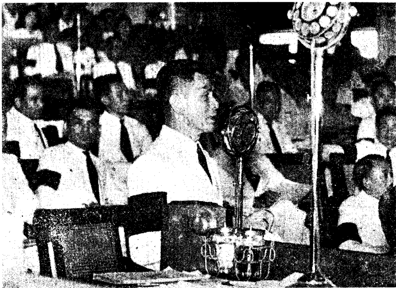
ภาพที่ 38 พล.ร.ต. ถวัลย์ ธำรงนาวาสวัสดิ์ กำลังตอบโต้ฝ่ายค้านในสภา ในการเปิดอภิปรายทั่วไป

รัฐบาลได้แสดงอุดมการณ์ยึดมั่นอยู่ในหลักประชาธิปไตย จึงให้มีการถ่ายทอดการอภิปรายทางวิทยุกระจายเสียงทั่วประเทศ ทั้งนี้เพื่อให้ราษฎรได้ทราบข้อเท็จจริงด้วยตนเอง เพราะไม่แน่ใจว่าหนังสือพิมพ์จะรายงานข่าวได้ถูกต้องทุกประการ