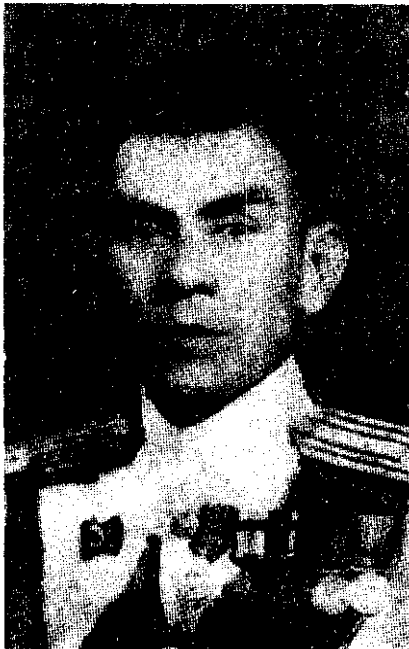
ภาพที่ 37 พลเรือตรี ถวัลย์ ธำรงนาวาสวัสดิ์

รัฐบาลเข้าแถลงนโยบายเพื่อขอความไว้วางใจโดยนโยบายหลักยังคงใช้นโยบายเดียวกันกับรัฐบาลชุดนายปรีดี พนมยงค์ รัฐบาลได้รับความไว้วางใจด้วยคะแนนเสียง 147:45 37 และเข้าบริหารประเทศ โดยมีพรรคสหชีพ พรรคแนวรัฐธรรมนูญเป็นพรรคฝ่ายรัฐบาล และพรรคประชาธิปัตย์เป็นพรรคฝ่ายค้าน