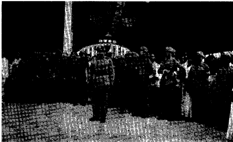
ภาพที่ 17 นายรัฐมนตรีต้อนรับทหาร ที่กลับจากปราบกบฏที่สถานีรถไฟกรุงเทพ

ธันวาคม พ.ศ. 2476 จึงได้เสด็จพระราชดำเนินเปิดประชุมสมัยสามัญแห่งสภาผู้แทนราษฎร 14 อย่างไรก็ดีตามอ้างกล่าวได้ว่า กบฏบวรเดชได้มีส่วนกระทบกระเทือนต่อพระองค์ ทรงไม่ได้รับความเชื่อถือว่ามีได้มีส่วนรู้เห็น และผลของการปราบปรามตลอดจนการจับกุมสอบสวนนักโทษกบฏ จะเป็นสาเหตุความขัดแย้งนานาประการระหว่างพระองค์กับรัฐบาล และอ้างกล่าวได้ว่า นับจากกรณีกบฏบวรเดช ความสัมพันธ์ระหว่างคณะราษฎรกับรัชกาลที่ 7 ก็อยู่ในภาวะที่เป็นปัญหายิ่งขึ้น ด้วยฝ่ายรัฐบาลคณะราษฎรมีความเห็นว่าการกบฏครั้งนี้เกิดขึ้นเพื่อที่จะฟื้นฟูระบอบเก่า และทำลายการปกครองของคณะราษฎร 15