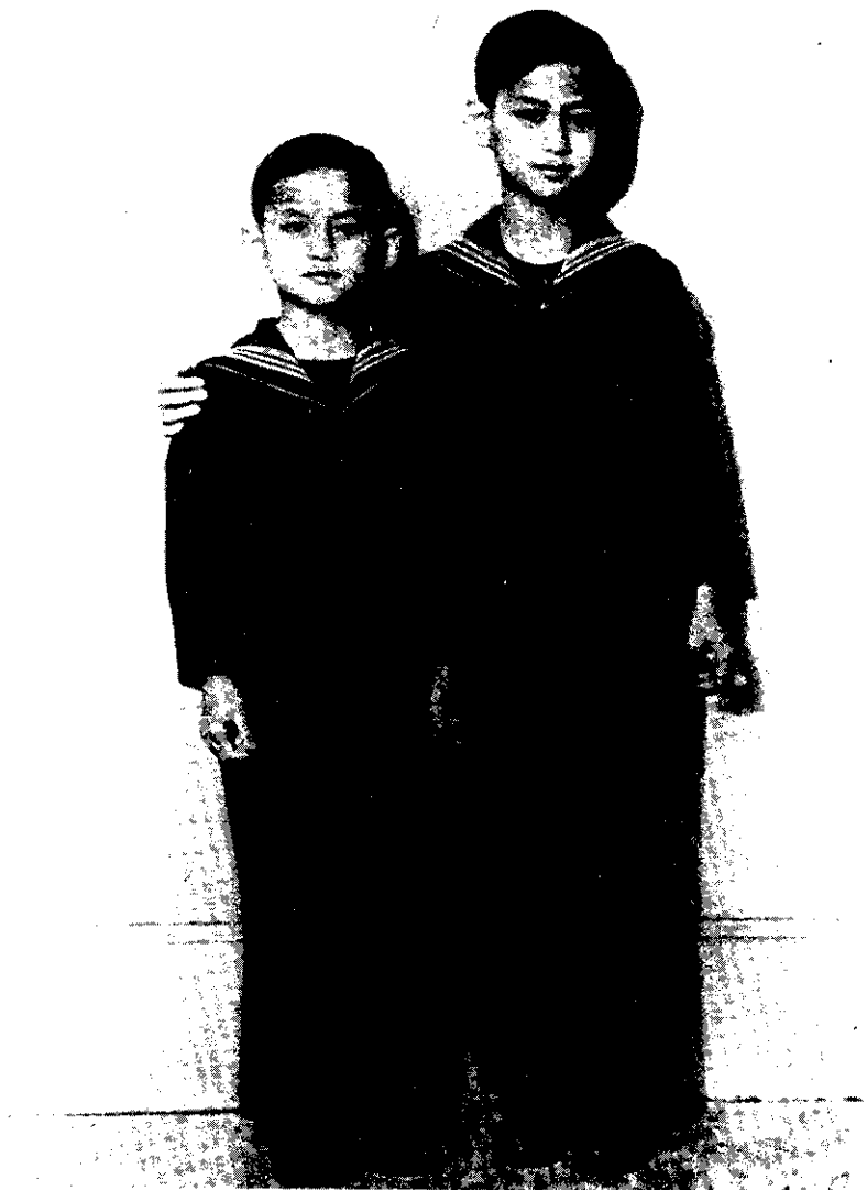
ภาพที่ 19 พระบาทสมเด็จพระเจ้าอยู่หัวอานันทมหิดล กับ สมเด็จพระราชอนุชา