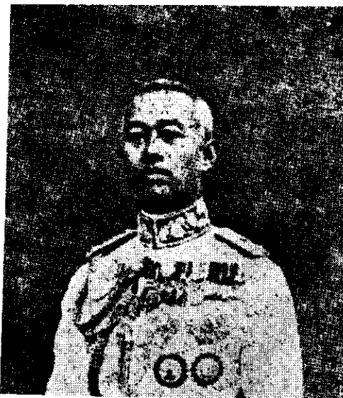
ภาพที่ 16 พระองค์เจ้าวรเดช กฤดากร

ย่อมมีความหวาดระแวงต่อฝ่ายตรงข้ามที่สูญเสียอำนาจ ดังนั้นหลวงพิบูลสงคราม และหลวงศุภชลาศัย จึงรับหน้าที่ในการควบคุมและปราบปรามฝ่ายตรงข้ามให้อยู่ในความสงบ ในขั้นแรกนั้นหลวงพิบูลสงครามและหลวงศุภชลาศัย ได้ร่วมมือกันส่งจดหมายเป็นเชิงเตือน ไปยังบรรดาผู้รัฐบาลไม่ไว้วางใจ โดยสงสัยว่าอาจจะมีพฤติกรรมเป็นปฏิปักษ์ต่อคณะรัฐบาล ซึ่งผู้ที่ได้รับจดหมายมีทั้งพวกเจ้า ข้าราชการ และสามัญชน สถานทางการเมืองดังกล่าว พระบาทสมเด็จพระปกเกล้าเจ้าอยู่หัว ทรงมีความห่วงใยในคณะรัฐมนตรีชุดเก่า จึงโปรดให้ราชาธิการในพระองค์ มีหนังสือแจ้งไปยังพระยามหพลพยุหเสนา เพื่อขอรับรองมิให้ฝ่ายรัฐบาล ดำเนินการรุนแรงต่ออดีตสมาชิกในคณะรัฐบาลพระยามโนปกรณนิติธาดาอีกต่อไป 5