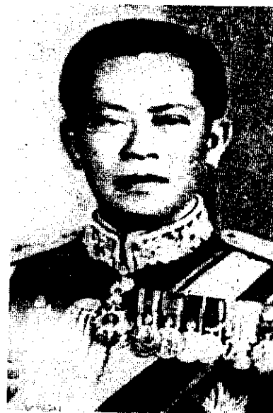
ภาพที่ 61 พลเอกเกรียงศักดิ์ ชมะนันทน์