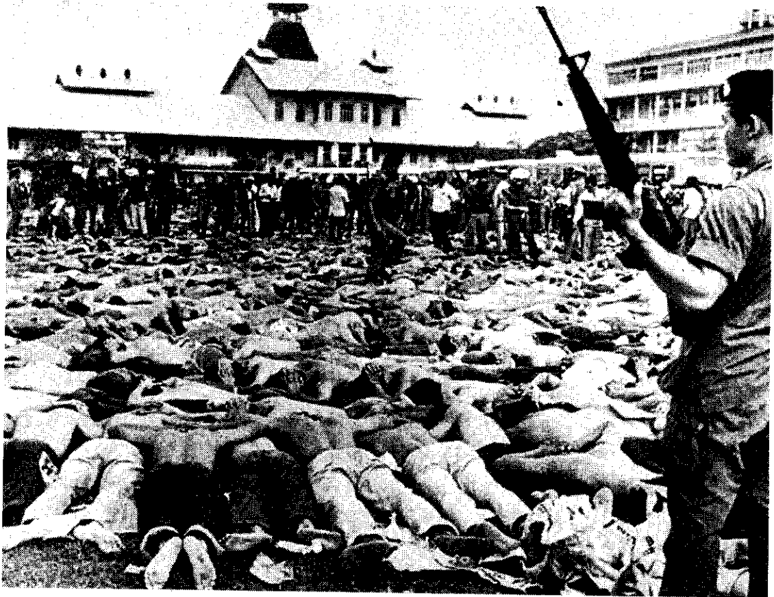
ภาพที่ 56 เหตุการณ์ 6 ตุลา

ประกอบไปด้วยนักศึกษา ครู อาจารย์ นักหนังสือพิมพ์ กรรมกร และอีกฝ่ายหนึ่ง คือ กลุ่มอนุรักษ์ ได้แก่ ทหาร ชนชั้นสูงบางกลุ่ม ชนชั้นกลางบางพวก นักเรียนอาชีวะส่วนหนึ่ง รวมทั้งกลุ่มพลังอื่นๆ ซึ่งมีความขัดแย้งทางความคิดและอุดมการณ์ทางการเมืองระหว่างกัน 50