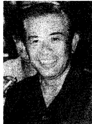
ภาพที่ 48 พันเอกณรงค์ กิตติขจร

การเมืองหลังรัฐประหาร พ.ศ. 2514 อีกประเด็นหนึ่งที่จะต้องพิจารณาคือ การมีอำนาจของพันเอก ณรงค์ กิตติขจร บุตรชายของจอมพล ถนอม กิตติขจร และบุตรเขยของจอมพล ประภาส จารุเสถียร พันเอก ณรงค์ ดำรงตำแหน่งรองเลขาธิการคณะกรรมการตรวจและติดตามผลปฏิบัติราชการ (ก.ต.ป.) หน่วยงานที่มีอำนาจมาก ทำหน้าที่ตรวจตราการปฏิบัติราชการของราชการ มีบุคคลทั้งนักธุรกิจและข้าราชการถูกสอบสวน บทบาทของ พันเอก ณรงค์ ทำให้ทหารบางกลุ่มไม่พอใจ เพราะเกรงว่า พันเอก ณรงค์ จะสืบทอดอำนาจทางการเมืองและการทหารสืบต่อจากบิดาและจอมพล ประภาสและพันเอก ณรงค์ "... ได้กลายเป็นสัญลักษณ์แห่งความจงเกลียดจงชังของ