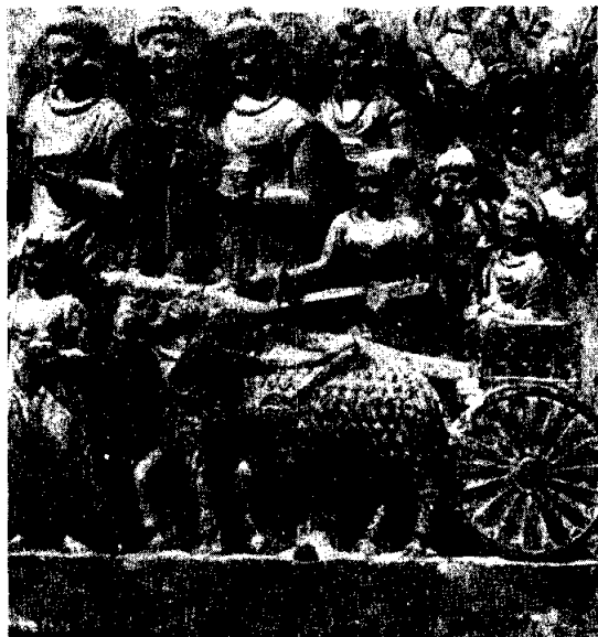
เจ้าชายสิทธัตถ์ละเสด็จไปศึกษา ศิลปะคันธาระ