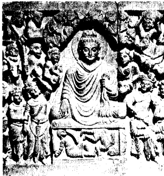
ตรัสรู้ ศิลปะคันธาระ