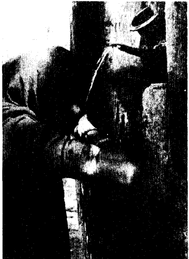
คูรดืมน้ำจากคนวรรณะอื่นที่รินให้

ง. ชั้นต่ำ คือ ผู้ที่เกิดในตระกูลต่ำ เช่น ชาวนา ชาวไร่ หรือกรรมกรรับจ้างทั่วไป พวกนี้มีความเป็นอยู่แตกต่างจากชนชั้นสูงมาก ชีวิตของพวกเขาชื่อ “หาเช้า กินค่ำ” ชีวิตไม่มีความหมาย นอนรอความตายไปเพียงวัน ๆ เท่านั้น ชนวรรณะอื่น ๆ ดูถูกชนชั้นนี้มาก