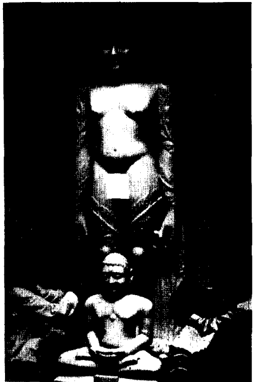
ภาพศาสดามหาวีระ

3.2.3 ทรงเผยแพร่วัฒนธรรมอยู่ 30 ปี โดยตั้งระบบนักบวชเปลือยอย่างเคร่งครัด ได้บรรลุกไกวลย์ (ตาย) ที่เมืองปาวานูรี ไกล ๆ เมืองราชคฤห์ทางภาคตะวันออกเฉียงเหนือของอินเดียเมื่อพระชนม์ได้ 72 พรรษา