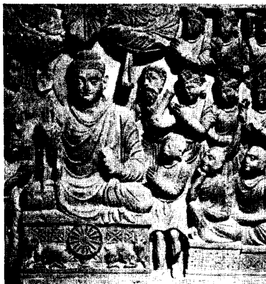
แสดงปฐมเทศนา ศิลปะคันธาระ