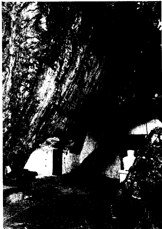
สถานที่บำเพ็ญทุกรกิริยาที่ภูเขาดงคศิริ เมืองคยา