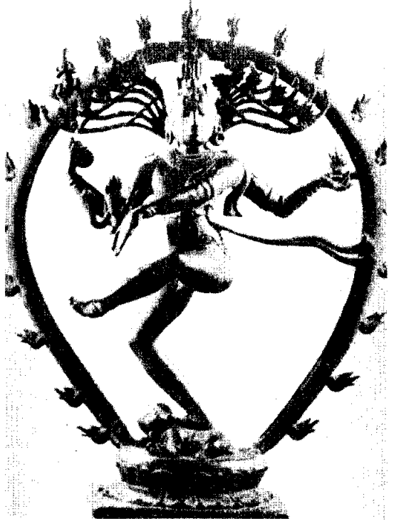
ศิวะปางนาถราช