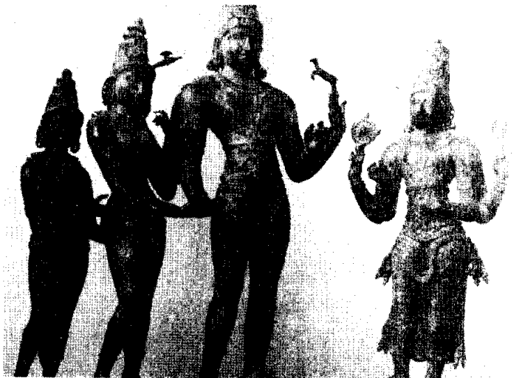
พระศิวะกับเจ้าแม่อุมาเทวีและเจ้าแม่ปารวตี พระวิษณุหรือพระนารายณ์อยู่ด้านขวามือ