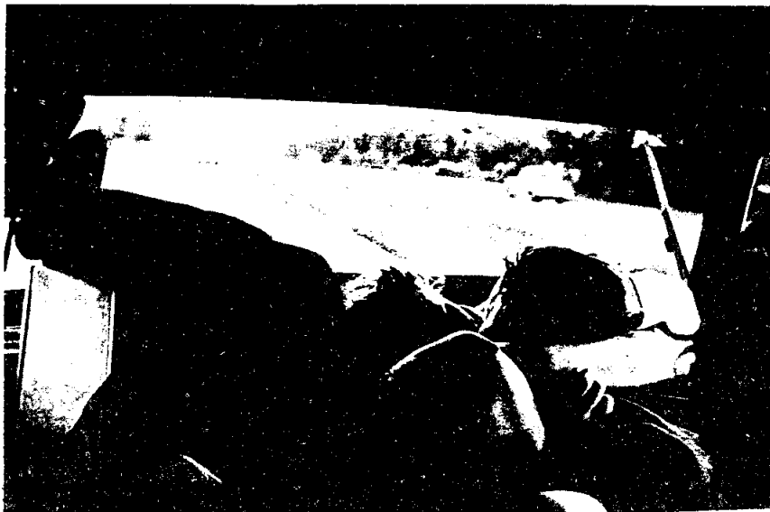
รูปจาก -Skolnick Arlene, The intimate Enviroment 2 nd Ed. P. 12, 368.