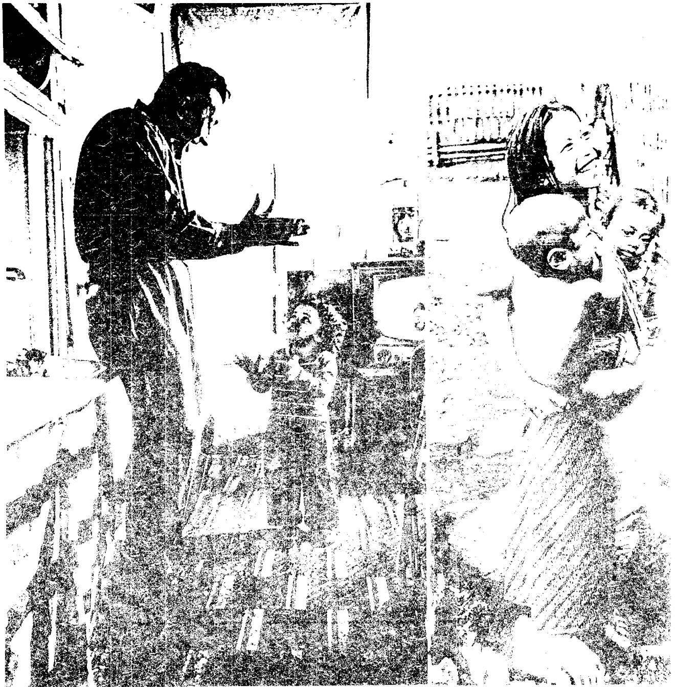
ภาพ แสดงถึงการช่วยเหลืองานบ้าน ของบิดาและของบุตรคนโต