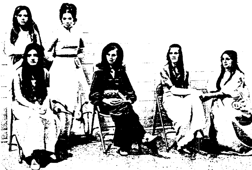
เป้าหมายของสตรีโสด คือ การเข้าสังคมในชนชั้นเดียวกัน