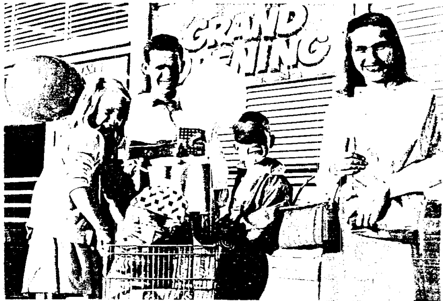
ครอบครัวที่บรรลุเป้าหมายของชีวิต