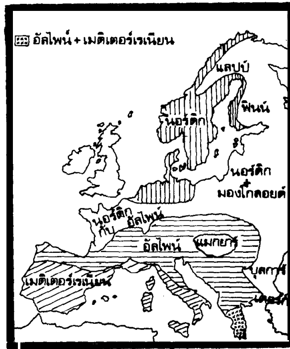
ยุโรป : กลุ่มเชื้อชาติที่สำคัญของประชากร