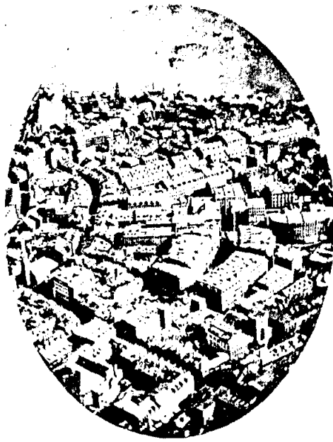
รูปที่ 15.2 ภาพเมืองบอสตันในสหรัฐอเมริกา ถ่ายจากบอลลูนในปี ค.ศ. 1860