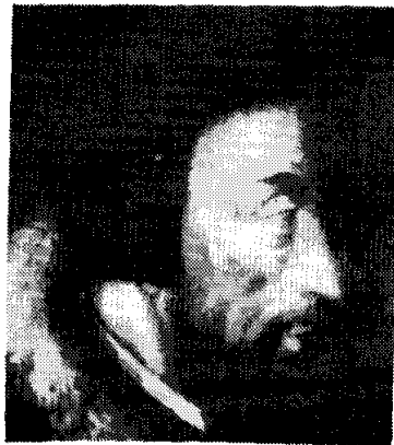
รูปที่ 2 จอห์น คาลวิน

พวกพิวริตันคือกลุ่มคนที่เชื่อว่าการที่อาดัมขัดคำสั่งของพระเจ้า (Adam's Fall) 2 เป็นต้นเหตุให้มนุษย์ทุกคนมีบาปกำเนิด (Original Sin) พระเจ้าจะทรงคัดเลือกบุคคลบางกลุ่ม (The Elect) ให้ได้รับการอภัยโทษ (A Covenant of Grace) ดังนั้นพวกพิวริตันจึงมุ่งเน้นที่การศึกษาตนเอง ศึกษาโลก และศึกษาพระคัมภีร์ไบเบิลเพื่อให้เกิดความสงบทางจิตใจ การมุ่งเน้นที่สามัญสำนึกของแต่ละบุคคลในการเข้าถึงพระเจ้าทำให้พวกพิวริตันลดความสำคัญของพิธีกรรมทางศาสนาลง พวกเขาเชื่อว่าการเคารพบูชาพระเจ้าควรเป็นไปแบบไม่มีพิธีรีตอง พิธีกรรมทางศาสนาควรเรียบง่ายไม่ยุ่งยากซับซ้อน พวกที่เคร่งครัดมากไม่เห็นด้วยกับการเคารพรูปปั้นของพระเจ้า ไม่นิยมใช้กระจกสีตกแต่งหน้าต่างโบสถ์และไม่นิยมการสร้างหน้าต่างกระจกโบสถ์ที่มีลวดลายงดงาม นอกจากนั้นพวกพิวริตันยังมีความคิดว่านักบวชทุกคนในศาสนาควรมีตำแหน่ง เท่าเทียมกันและมีหลักการทางศาสนาตามแนวทางของผู้นำการปฏิรูปทางศาสนาชาวฝรั่งเศสชื่อ จอห์น คาลวิน