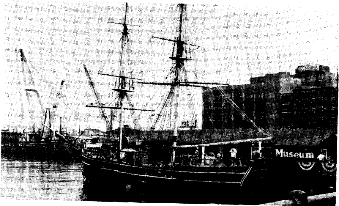
รูปที่ 6 The Boston Tea Party