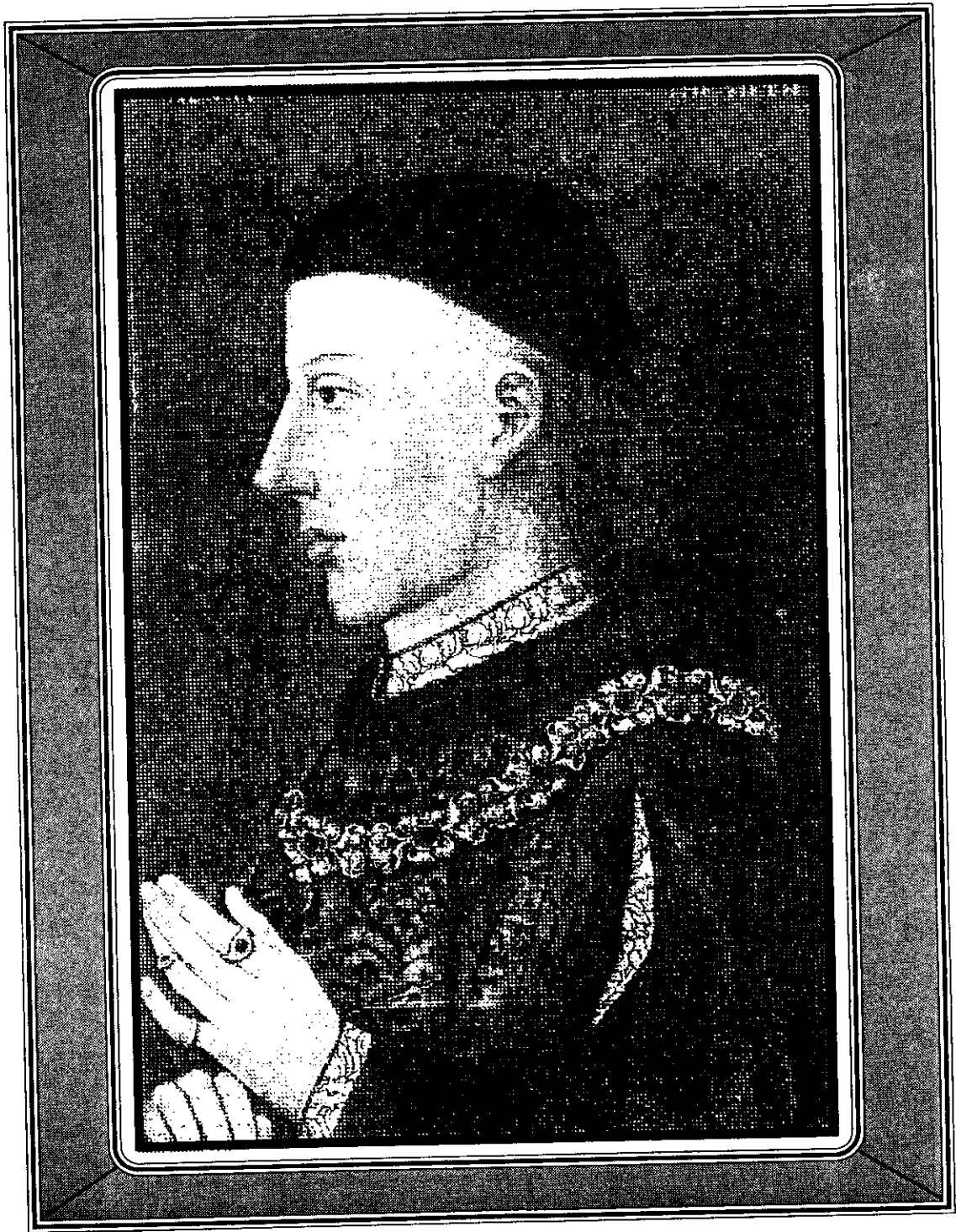
ภาพที่ 12 พระบรมฉายาลักษณ์ของพระเจ้าเฮนรีที่ 5