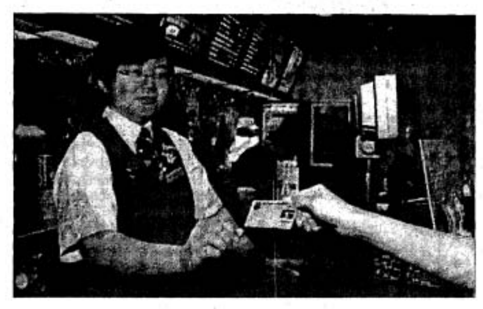
An employee of American fast food chain Burger King receives a Visa card from a customer in Singapore yesterday.