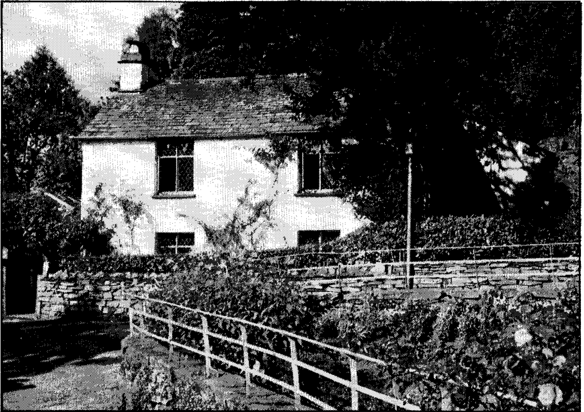
Dove Cottage, Grasmere