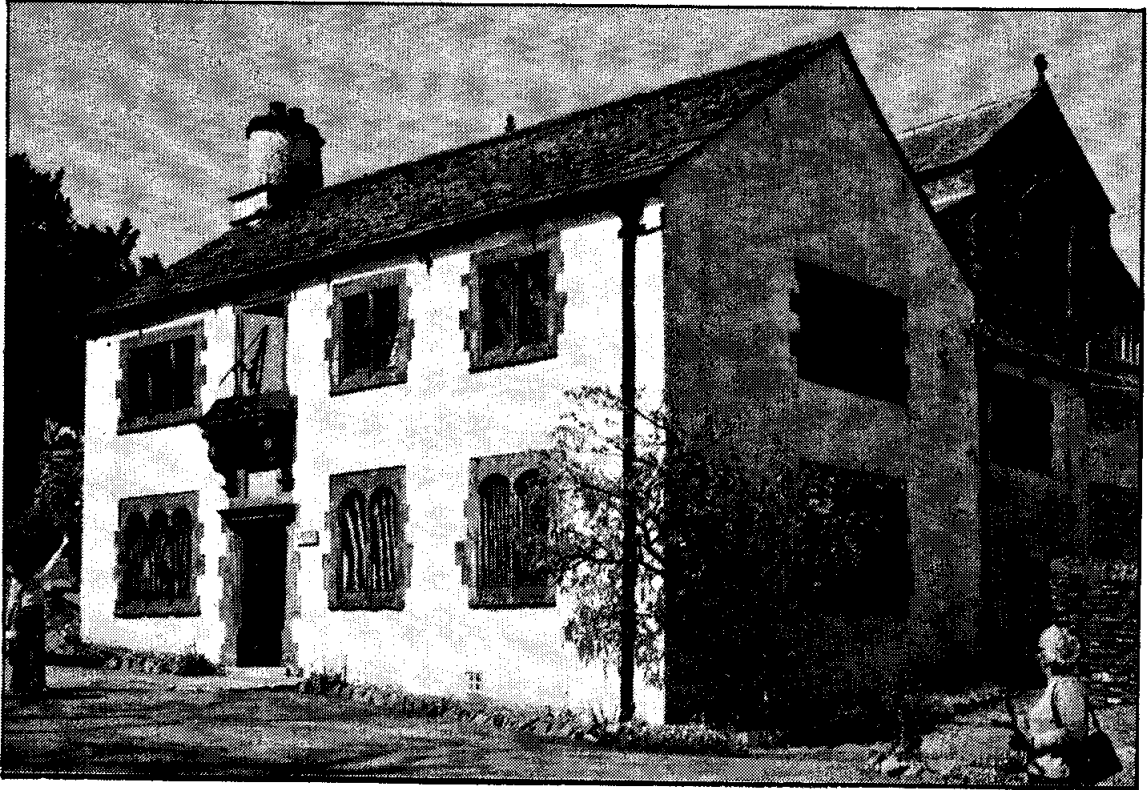
The Old Grammar School, Hawkshead