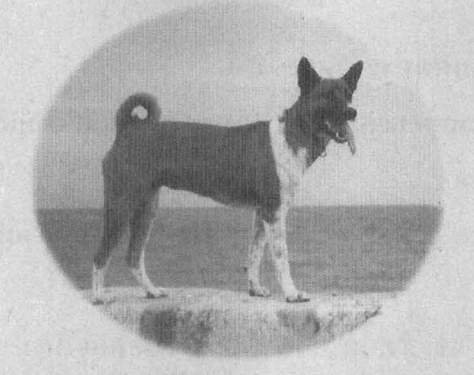
Klaikangvol Palace, September 21, 1999.

Apart from being clever and quick to understand, it seems that Tongdaeng has the gift of telepathy, and can use it effectively. On many occasions, Tongdaeng's children would run off to play far from His Majesty. As for Tongdaeng, she would scout about in front of the King, then come back to him. On one occasion, when the King thought that Tongdaeng's children had strayed too far away, he said "Tongdaeng, go and fetch Tongmuan." (Tongdaeng's number three offspring) Tongdaeng stood up and gazed out in that direction; in an instant, Tongmuan came running back.