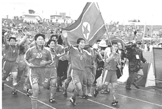
กิจกรรมชมรมฟุตบอลของนักศึกษาหญิงในมหาวิทยาลัยประเทศเกาหลีเหนือ

4.4 มัธยมศึกษาตอนปลาย (Upper – secondary school) การศึกษาของเกาหลีใน ระดับนี้จะใช้เวลาเรียน 2 ปี ส่วนมากจะเรียนวิชาที่เกี่ยวกับการต่อในมหาวิทยาลัยหรือไม่ก็ เพื่อฝึกเข้าเรียนในโรงเรียนฝึกหัดครู ระดับมัธยมศึกษาตอนปลายจะรวมเอาโรงเรียนทั่วไปซึ่ง ใช้เวลาเรียน 3 ปีเน้นการเรียนเพื่อฝึกฝนวิชาความรู้ทางด้านวิทยาศาสตร์ คณิตศาสตร์