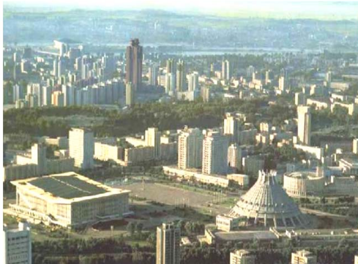
ที่ตั้งของกรุงเปียงยางและสภาพของกรุงเปียงยางในปัจจุบัน