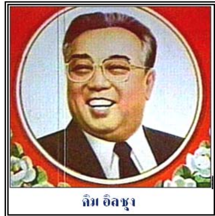
คิม อิลซุง

พัฒนาการการศึกษาของเกาหลีเหนือ จะแบ่งออกเป็น 3 ช่วง คือ ช่วงก่อตั้ง ช่วงการปรับปรุงสู่สภาพเดิม และช่วงที่ทำให้มั่นคง โดยแต่ละช่วงก็จะมีจุดมุ่งหมายทางการเมือง ทางด้านเศรษฐกิจ และทางด้านการศึกษาที่แตกต่างกันในแต่ละช่วง