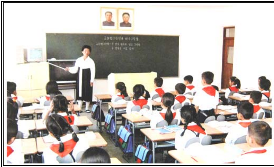
การเรียนคอมพิวเตอร์ในชั้นเรียน

จากจุดมุ่งหมายทางการศึกษาของเกาหลีเหนือดังกล่าว อาจจะกล่าวได้ว่า พรรคคอมมิวนิสต์มีบทบาทอย่างมากในการวางนโยบายทางการศึกษารวมทั้งกำหนดทิศทางของการศึกษาว่าจะดำเนินไปอย่างไร