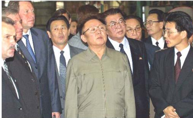
Kim Jong Il

ผู้นำประเทศ นายคิม จอง อิล (Kim Jong Il)