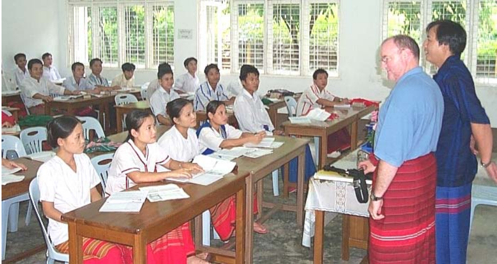
การเรียนการสอนใหม่มหาวิทยาลัย ประเทศพม่า

สำหรับการศึกษาพิเศษของสหภาพเมียนมาร์นั้นยังไม่มีโรงเรียนเฉพาะทางที่สอนให้แก่เด็กหูหนวก ตาบอด หรือทุพพลภาพทางด้านร่างกาย และปรากฏว่าผู้ปกครองส่วนใหญ่ไม่นิยมส่งบุตรหลานที่พิการให้เรียนร่วมกับเด็กปกติ ส่วนมากจะสอนอยู่ที่บ้าน ส่วนเด็กปัญญาเลิศนั้น ปรากฏว่ายังไม่มีโรงเรียนที่เปิดสอนหรือมีสถาบันเฉพาะที่จะรับเด็กเข้าเรียน การเรียนการสอนส่วนมากจะเปิดโอกาสให้เด็กได้รับความรู้ในชั้นประถมศึกษามากกว่าระดับอื่นกล่าวโดยสรุปแล้วรัฐบาลยังไม่ให้ความสำคัญกับการศึกษาพิเศษเลยซึ่งถือว่าเป็นภาระของผู้ปกครองที่จัดการเรียนการสอนหรือจัดโปรแกรมอย่างใดอย่างหนึ่ง เพื่อจุดมุ่งหมายที่อย่างน้อยเด็กเหล่านั้นสามารถดำรงตนอยู่ได้อย่างปกติสุขในสังคมแห่งสหภาพเมียนมาร์