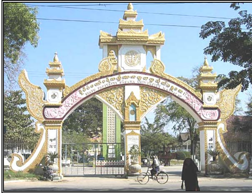
มหาวิทยาลัยมณฑลตะเลย์