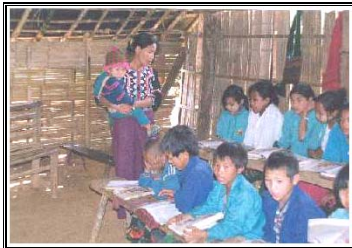
การเรียนการสอนในพื้นที่สูง

ทั้งหมด โรงเรียนประถมศึกษาในพม่าจะมีการรวมตัวอย่างจริงจังของสภาพสังคมชุมชน มีการสร้างโรงเรียนเพิ่มมากขึ้น แต่บางครั้งโรงเรียนต้องประสบปัญหาในการซ่อมแซมและปัญหาเงินงบประมาณอุดหนุน ทั้งนี้อาจจะเป็นเพราะว่าเหตุการณ์ความยุ่งยากอันเนื่องมาจากการเรียกร้องทางการเมืองของพม่าเป็นอุปสรรคสำคัญ