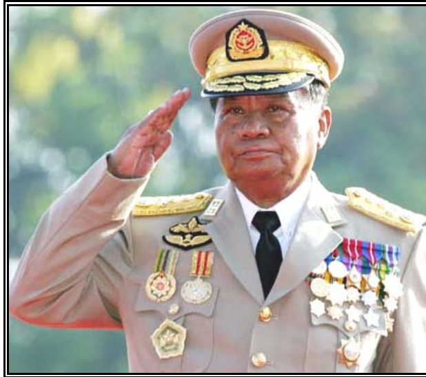
พลเอกอาวุโส ตาน ฉ่วย

เขตการปกครอง แบ่งการปกครองเป็น 7 รัฐ (state) สำหรับเขตที่ประชากรส่วนใหญ่เป็นชนกลุ่มน้อย และ 7 ภาค (division) สำหรับเขตที่ประชากรส่วนใหญ่เป็นเชื้อสายพม่า