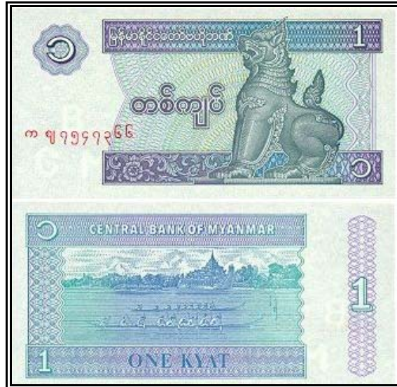
ธนบัตรพม่าราคา 1 Kyat

สินค้าส่งออก ก๊าซธรรมชาติ สิ่งทอ ไม้ซุง สินค้าประมง ข้าว ยาง อัญมณี และแร่ธาตุ สินค้านำเข้า เครื่องจักรกล ยาสังเคราะห์ น้ำมันดิบ ผลิตภัณฑ์ปิโตรเลียม และเหล็ก ตลาดนำเข้า จีน (ร้อยละ 28.9) สิงคโปร์ (ร้อยละ 20.7) และไทย (ร้อยละ 14) (2546) ตลาดส่งออก ไทย (ร้อยละ 30.2) อินเดีย (ร้อยละ 9) จีน (ร้อยละ 7) (2546)