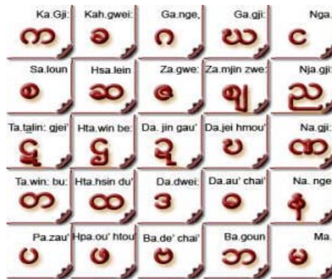
ตัวอักษรพม่า

รูปแบบการปกครอง ปกครองโดยคณะทหารภายใต้สภาสันติภาพและการพัฒนาแห่งรัฐ (State Peace and Development Council – SPDC) โดยมีประธาน SPDC เป็นประมุขประเทศ และมีนายกรัฐมนตรีเป็นหัวหน้ารัฐบาล