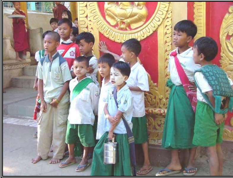
นักเรียนประถมประเทศพม่า(พ.ศ. 2549)