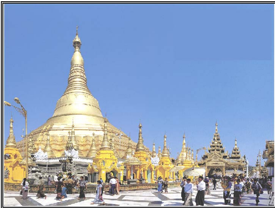
เจดีย์ชเวดากอง กรุงย่างกุ้ง ประเทศพม่า

สหภาพเมียนมาร์ มีพื้นที่ทั้งหมดประมาณ 261,220 ตารางไมล์ (ประมาณ 676,560 ตารางกิโลเมตร) ประชากรของประเทศเมียนมาร์ประมาณ 45,112,000 คน (ข้อมูลปี ค.ศ. 1994) ส่วนใหญ่นับถือศาสนาพุทธมีจำนวนถึง 90 เปอร์เซนต์ของประชากรทั้งหมดของประเทศ (Webster's New Encyclopedic Dictionary 1994, 1528)