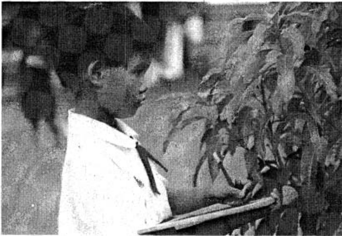
ภาพที่ 14 นักเรียนควรมีโอกาสได้สังเกต ตำรวจต้นไม้นอกห้องเรียน ความมุ่งหมาย

ราชการจังหวัด หมอ ตำรวจ กำนัน ผู้ใหญ่บ้าน ฯลฯ มาให้ความรู้และประสบการณ์แก่นักเรียนที่โรงเรียนก็ได้