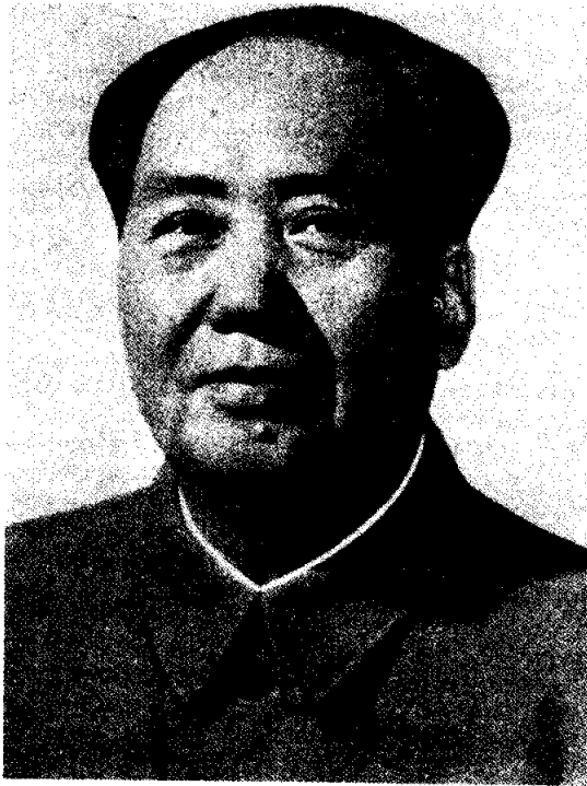
เหมาเจ๋อตง