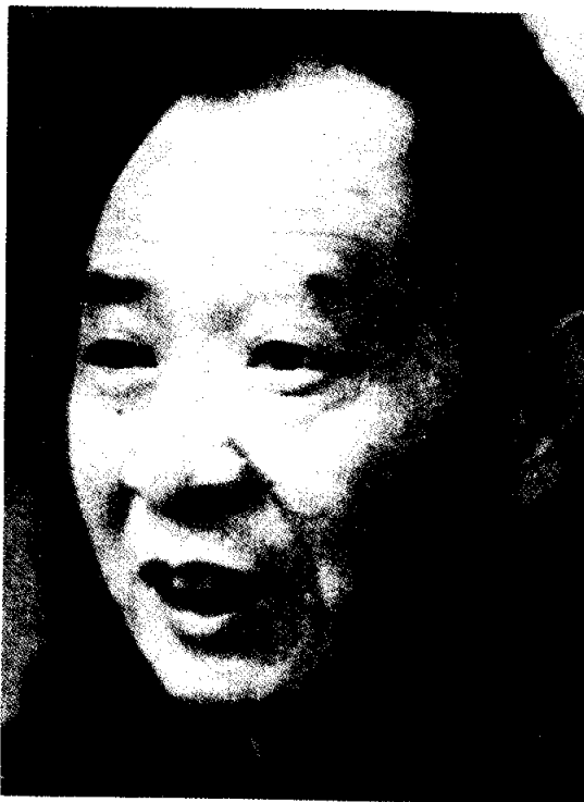
หูเหยาบัง