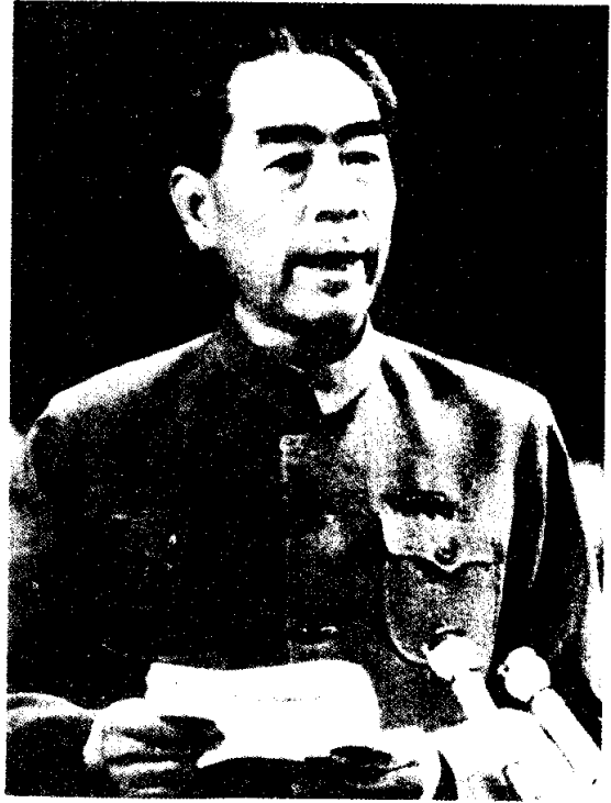
โจวเอินโถง