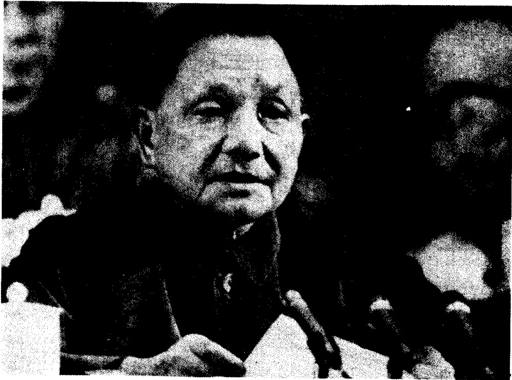
เติ้งเสี่ยวผิง