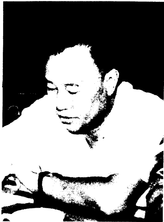
จ้าวจื่อหยาง