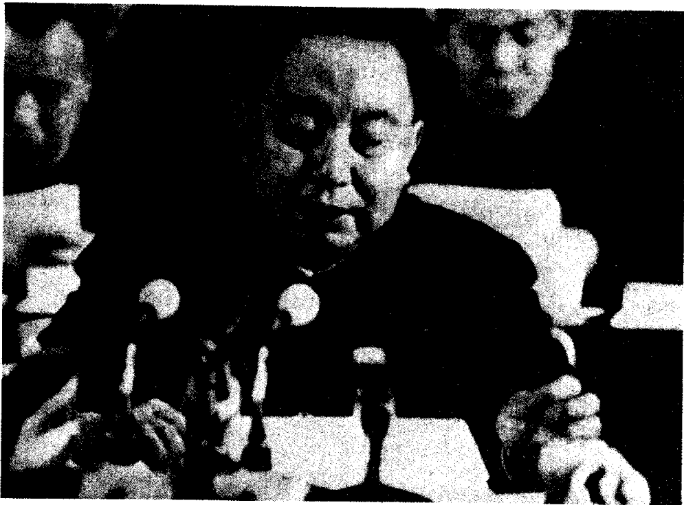
หัวโก๊ะฟง