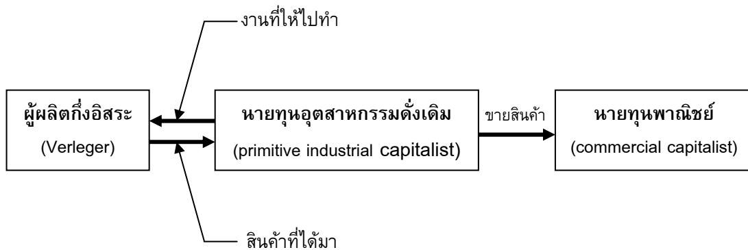
รูปภาพที่ 4.1 : แผนผังระบบให้งานไปทำได้สินค้ามา (putting-out or Verlag system)

ย้อนกลับมาที่บทบาทของพ่อค้าหลังสิ้นยุคกลาง พ่อค้ามิใช่มีบทบาทในการผลิตเท่านั้น แต่ยังมีบทบาทด้านการค้าทั้งภายในและต่างประเทศอีกด้วย ขณะเดียวกันฐานะทางเศรษฐกิจ สังคม และการเมืองของพวกเขาที่สูงขึ้นตาม รัฐชาติ (nation-states) ก็สนับสนุนการผูกขาดทางการค้า เพราะทำให้การค้าขยายตัวมากขึ้นและเป็นแหล่งรายได้ของรัฐบาลที่สำคัญ และสำหรับพ่อค้าแล้วการได้สิทธิผูกขาดเป็นวิธีการที่ดีที่สุดในการพัฒนาโรงงานหัตถอุตสาหกรรม การขยายการค้า และการสร้างกำไรมหาศาล โดยเฉพาะการผูกขาดการค้ากับต่างประเทศของบริษัทใดบริษัทหนึ่ง มีความจำเป็นมากในสมัยนั้น เพราะการค้าต้องเผชิญภัยและมีความเสี่ยงสูง ขณะเดียวกันสถาบันกษัตริย์ก็มีค่าใช้จ่ายสูง เพื่อรักษาและสร้างความเข้มแข็งให้สถาบัน การปกป้องผลประโยชน์ทางการค้าระหว่างประเทศจึงเป็นที่มาของแหล่งรายได้ที่สำคัญ