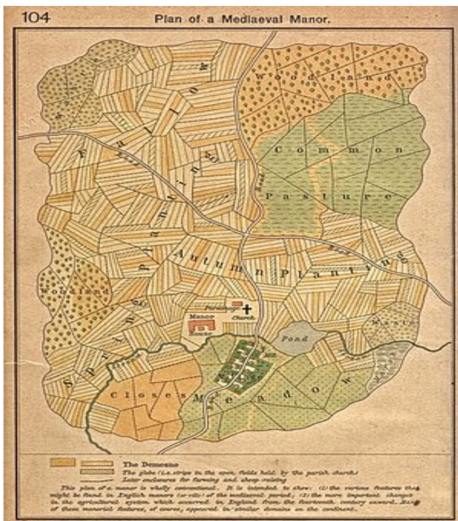
รูปภาพที่ 3.2 : ระบบการผลิตแบบขุนนางศักดินา (manorial system)