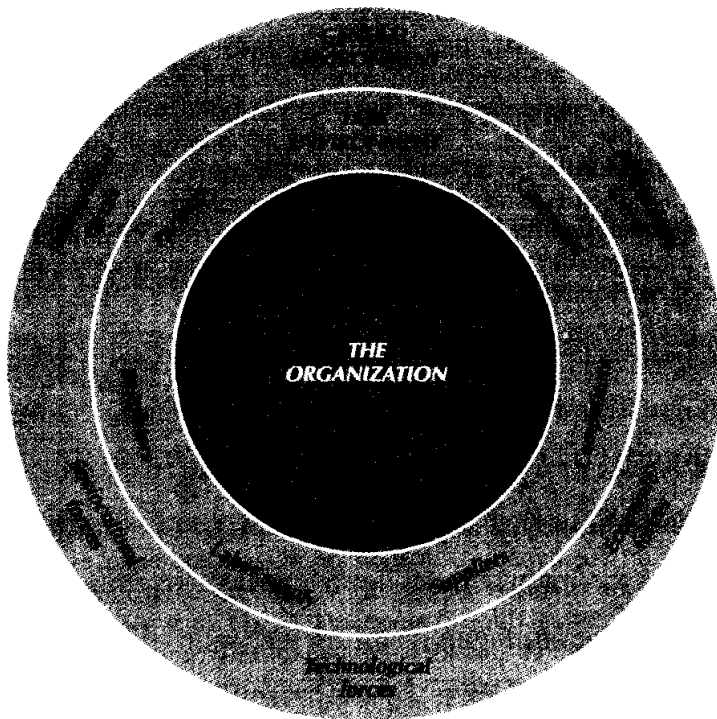
แผนภาพที่ 10 แสดงสิ่งแวดล้อมขององค์กร (โบวีและคณะ, 1993:72)

สามารถวางแผน จัดองค์กร จัดคนลงสู่งาน อำนาจการ ประสานงาน รายงาน และจัดทำงบประมาณได้อย่างเป็นผลดี ในส่วนของการอำนาจการนั้น เป็นการควบคุม ดูแล กำกับ และสามารถตัดสินใจในเรื่องที่เกี่ยวข้อง และมีความสำคัญ ๆ ได้อย่างถูกต้อง มีเหตุมีผล และสามารถก่อให้เกิดประโยชน์หรือเป็นผลดีแก่องค์กรโดยส่วนรวม การที่จะสามารถกระทำเช่นนี้ได้ นักบริหารการศึกษาผู้นั้นจะต้องเป็นผู้ที่รอบรู้ มีความกว้างขวางในศาสตร์สาขาต่าง ๆ ที่เกี่ยวข้อง ทำให้สามารถที่จะได้รับข้อมูลข่าวสาร เลือกสรรเอาข้อมูลที่เหมาะสมมาใช้อย่างถูกต้องเหมาะสม เพื่อหวังผลประโยชน์สูงสุดแก่องค์กร