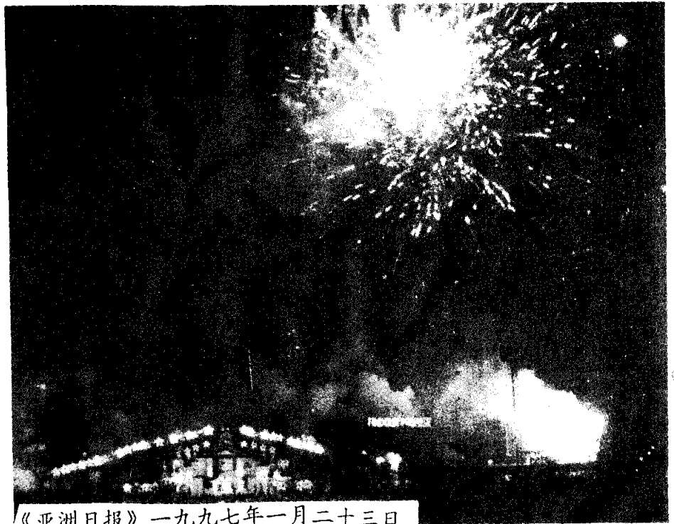
《亚洲日报》一九九七年一月二十三日

第廿四屆泰國大學運動會或華目運動會屆閉幕時刻，大放煙火，到處火樹銀花，金光燦爛，下屆規定在瑪希倫大學舉行。