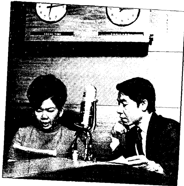
การทำข่าว