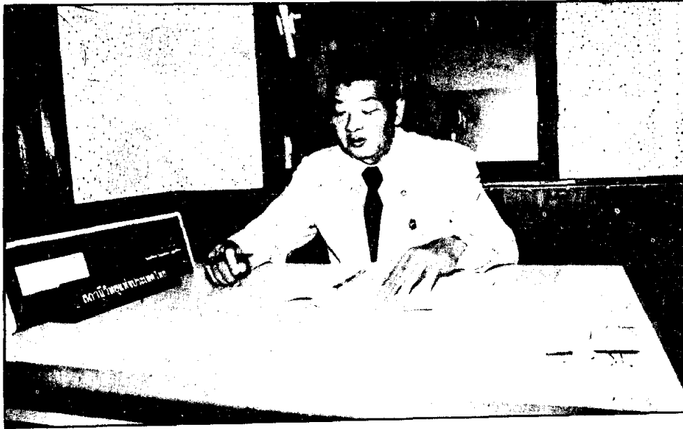
ผู้ประกาศสถานีวิทยุกระจายเสียงแห่งประเทศไทย

ความแตกต่างระหว่าง Hard News กับ Soft News คือ