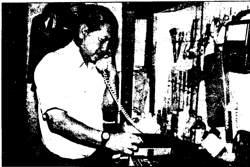
ข่าวประกอบเสียง