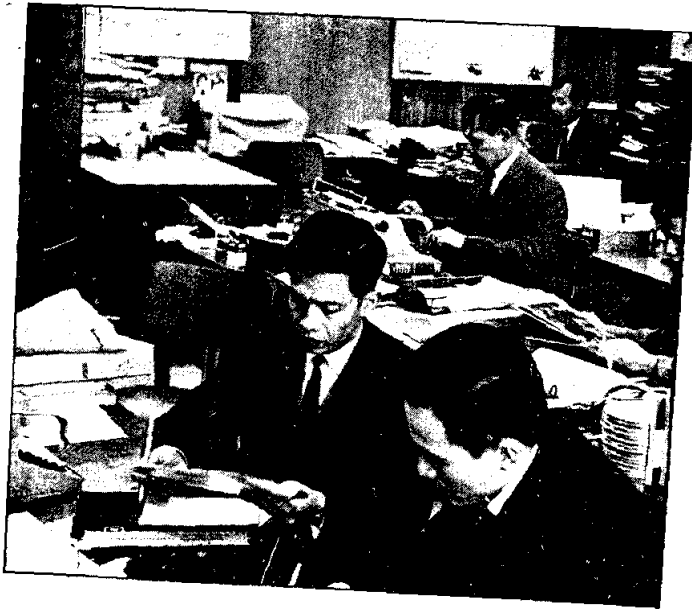
การเรียงเรียงข่าว