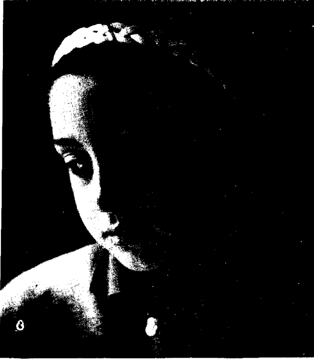
ตัวอย่างการถ่ายภาพคน