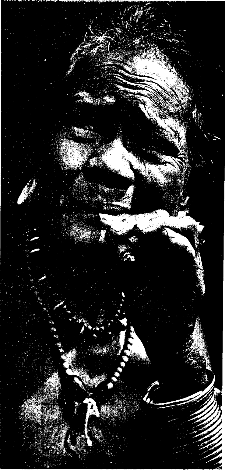
ภาพแสดงรายละเอียดของภาพ