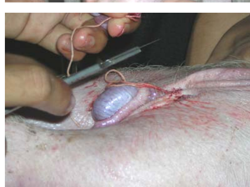
ภาพที่ 19.1 การตอนสุกรบริเวณอุ้งอ้นตะ